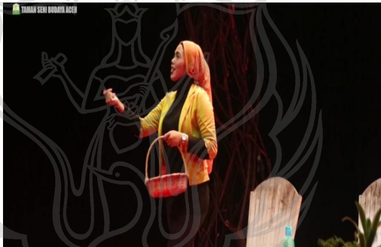
Gambar 1. Tokoh Dona Laura, Pementasan Pagi Bening Sanggar Kriya Artistika.

Karakter Dona Laura dalam naskah Pagi Bening memiliki beberapa kesamaan dengan tokoh Nenek dalam naskah Pada Suatu Hari karya Arifin C. Noer. Kedua tokoh sama-sama merupakan perempuan lanjut usia yang memiliki energi hidup tinggi, aktif berbicara, dan menunjukkan sifat cerewet. Meskipun demikian, keduanya memiliki latar konflik yang berbeda. Dona Laura berhadapan dengan kesepian dan