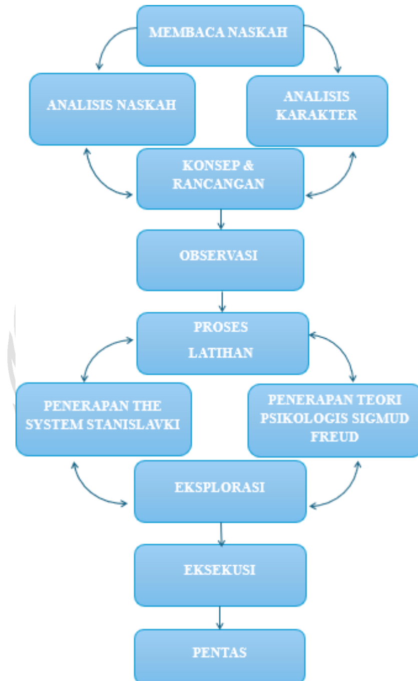
Gambar 3. Peta Konsep.

Berikut merupakan peta konsep dalam pemeranan tokoh Nenek dalam naskah Pada Suatu Hari karya Arifin C.Noer :