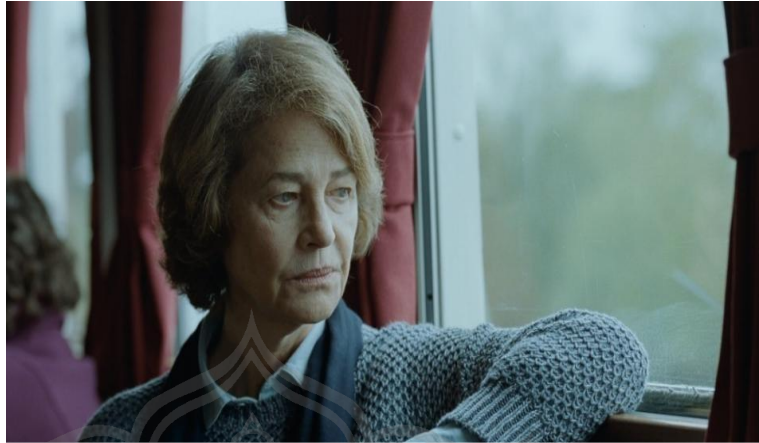
Gambar 2. Tokoh Kate Mercer dalam Film 45 Years (2015).

Karakter Kate Mercer yang diperankan oleh Charlotte Rampling dalam film 45 Years memiliki relevansi dengan tokoh Nenek dalam naskah Pada Suatu Hari karya Arifin C. Noer. Keduanya merupakan perempuan lanjut usia yang menghadapi konflik emosional dalam hubungan pernikahan yang telah berlangsung lama. Kate maupun Nenek sama-sama mengalami kecemburuan, rasa tidak aman, dan ketakutan kehilangan pasangan yang mereka cintai.