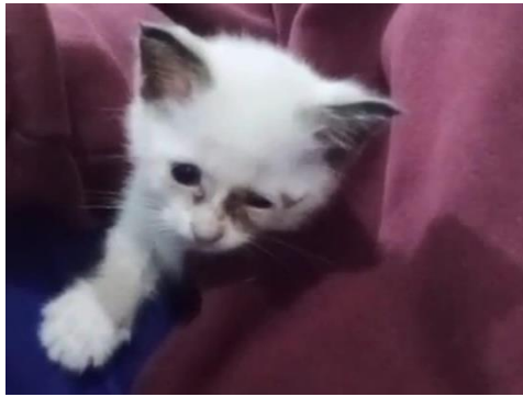
Gambar 1. 2 Potret Awow bersama penulis