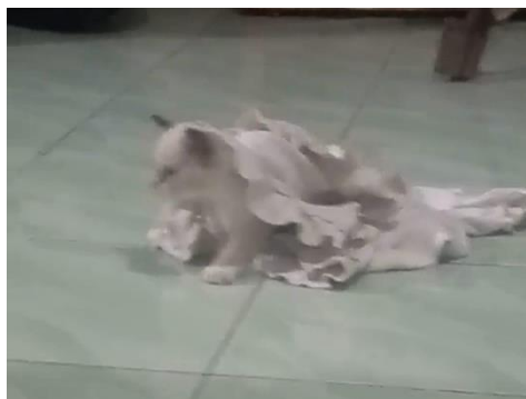
Gambar 1. 1 Kucing peliharaan penulis, Awow

Semua dimulai sejak kedatangan dua ekor anak kucing yang tiba-tiba memasuki rumahnya, penulis merasa takjub dan gembira melihat kedatangan mereka lalu bermain bersama. Saat itu, penulis hanya memberikan mereka makanan tanpa membersihkan atau memberi perawatan atau apa pun karena terlalu asyik bermain. Melihat hal ini, orang tua penulis ambil andil dalam memberi nasihat kepada penulis tentang apa saja yang harus dilakukan dalam merawat kucing. Kemudian mereka berkembang biak dan kucing-kucing semakin banyak, selain itu juga ada kucing dari tempat lain yang berdatangan silih berganti membawa suasana baru dalam setiap momen.