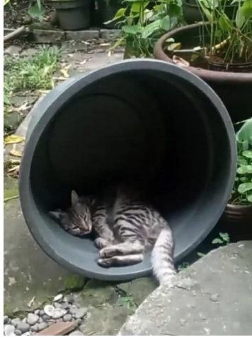
Gambar 1. 4 Potret Iwiw bermain di kebun belakang rumah