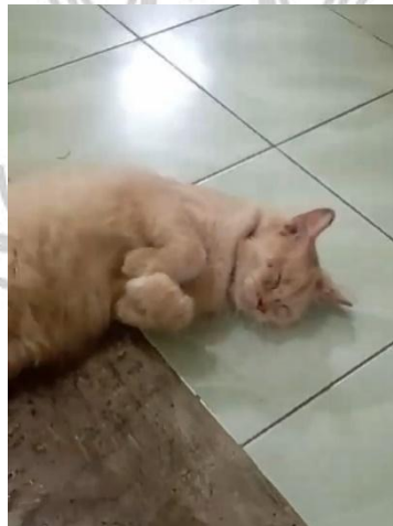
Gambar 1. 3 Potret Uwuw yang sedang tidur

Namun, dari semua pengalaman itu penulis menyadari bahwa penulis belum sepenuhnya belajar dari kesalahan masa lalu, yaitu kurangnya sikap tanggung jawab dalam memelihara. Pola buruk itu pun berulang kepada kucing yang datang selanjutnya. Meskipun penulis mulai menunjukkan perubahan sikap seperti lebih memperhatikan kebutuhan dasar kucing, hal itu masih belum cukup untuk menebus kesalahannya pada masa lampau serta belum menggambarkan sosok pemelihara yang baik yang mana mendambakan hubungan yang lebih dalam dari sekedar teman bermain. Hingga pada kucing-kucing penulis yang terakhir dipeliharanya, yang mana dua ekor kucing rumahan diberikan dari keluarga sepupu, juga tidak berakhir baik. Mereka mengidap penyakit dan penulis tidak mampu untuk membawa mereka ke klinik hewan dan berakhir pergi dari rumah penulis.