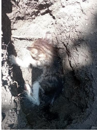
Gambar 1. 6 Penulis menguburkan mayat kucing di kebun belakang rumah