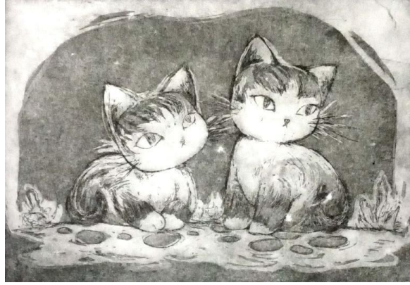
Gambar 1. 5 Salah satu karya intaglio penulis berupa potret anak-anak kucing