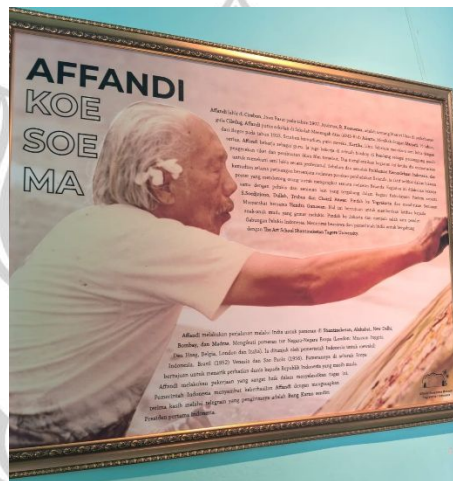
Biografi Singkat Affandi