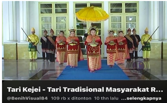
Gambar 3. Tari Kejei Tari Tradisional Masyarakat Rejang (Sumber: Kanal Youtube, 2015)

https://youtu.be/0mr6kkQ2PNk?si=ayTMzLPqSXW6U4KL