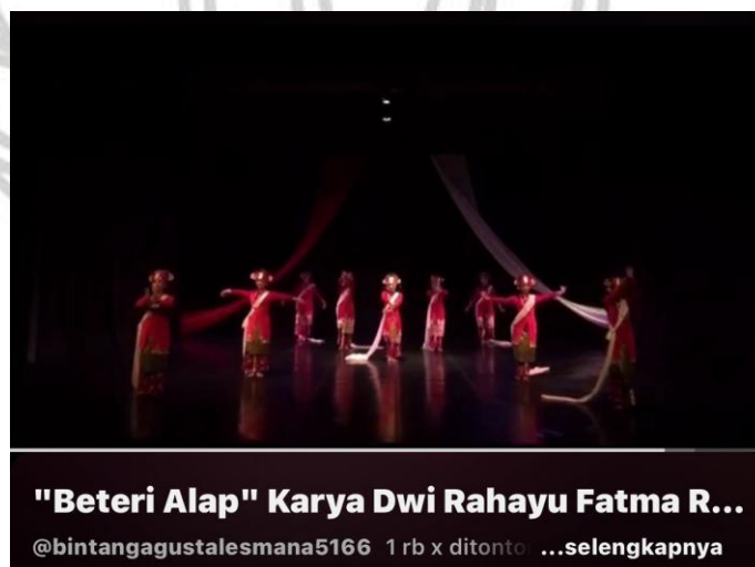
Gambar 1. "Beteri Alap" Karya Dwi Rahayu Fatma Reika tahun 2016

https://youtu.be/SggZY4_I1jE?si=lePSFGBg27PhaJGk