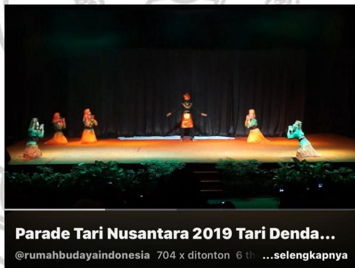
Gambar 2. Parade Tari Nusantara 2019 Tari Dendam Tak Sudah (Sumber: Kanal Youtube, 2019)

https://youtu.be/jnqUX24pJmE?si=AieR15J2ayP2aTJy