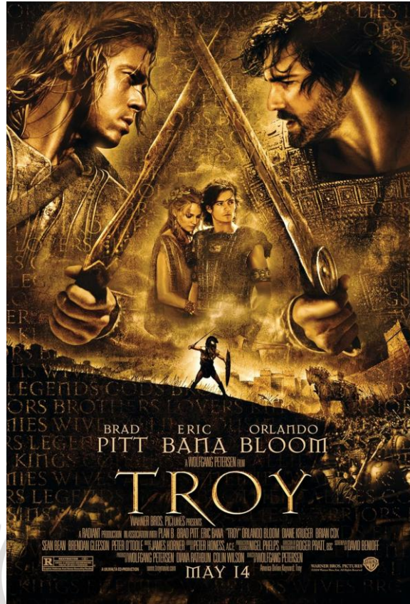
Gambar 1.2. Poster film Troy , disutradarai oleh Wolfgang Petersen, 2004.