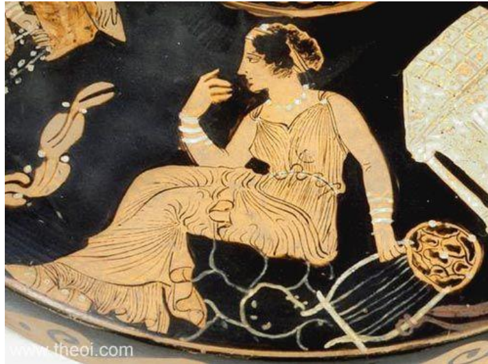
Gambar 1.4. Tembikar peninggalan masyarakat Yunani Kuno II

Aspek yang telah dijabarkan itu menjadi inspirasi bagi penulis untuk menuangkannya ke dalam karya seni lukis. Ada banyak sekali unsur-unsur yang dapat diangkat dan dikembangkan lebih dalam lagi, mulai dari simbol, metafora, kebendaan, suasana, hingga latar belakang. Selain itu, kisah Perang Troya juga dapat bersifat aktual jika menarik jembatan narasi ke masa sekarang melalui penggambaran objek dan unsur-unsur yang mewakili sebuah linimasa tertentu. Pengaktualisasian masa kini dari kisah Perang Troya bisa direnungkan dari pengambilan makna pada setiap narasi penting yang ada dalam Perang Troya— yang jika ditarik garis memiliki kemiripan walaupun tidak secara gamblang. Hal ini menunjukkan sebuah fakta mengenai tabiat manusia yang tidak berevolusi dan cenderung stagnan sejak zaman dahulu. Hanya dipisahkan oleh elemen dan pada momen yang berbeda.