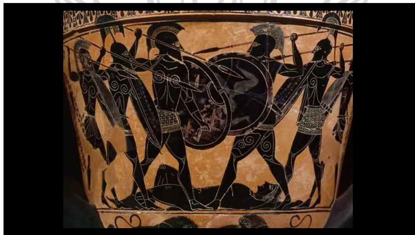
Gambar 1.3. Tembikar peninggalan masyarakat Yunani Kuno I.