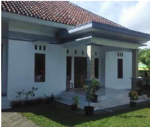
Rumah Bu Lela