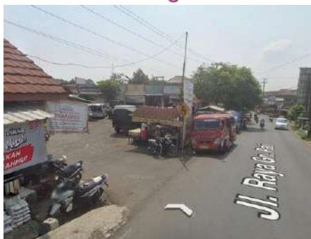
Tempat Parkir Angkot