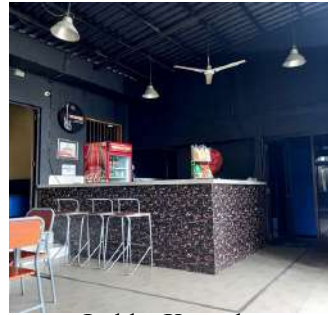
Lobby Karaoke