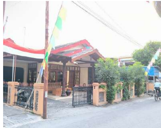
Rumah Ninis