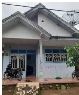
Teras Kontrakan

Rumah kecil di pedesaan yang cukup padat penduduk. Selalu ada jarak lahan kosong di setiap rumah. Terasnya tidak luas, tapi cukup untuk memarkirkan motor dan membuat tali gantung jemuran. Halamannya cukup luas untuk bermain anak-anak. Warna catnya biru dan pudar.