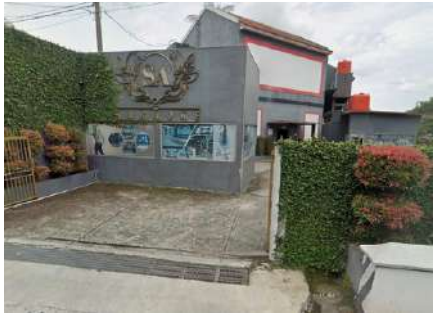
Pintu Masuk Karaoke