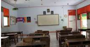
Ruang Kelas

Ruang kelas Uni yang penuh dengan tempelan dinding. Jadwal piket, jadwal pelajaran, majalah-majalah dinding, dan informasi-informasi lainnya.