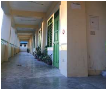
Lorong Kelas

Lorong sekolah yang rapi dan tertata, warna catnya selalu ganti setiap tahun ajaran baru. Kursi-kursi panjang diletakkan di depan setiap ruangan.