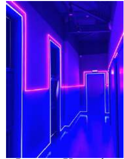
Lorong Karaoke