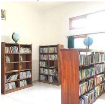
Perpustakaan Sekolah

Perpustakaan sekolah yang tidak terlalu ramai setiap harinya membuat ruangan selalu dingin karena AC yang selalu menyala. Rak buku yang berjejer membentuk lorong-lorong buku menuju ke barisan meja di bawah jendela yang menghadap langsung ke halaman depan sekolah.