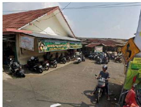
Tempat Parkir Angkot