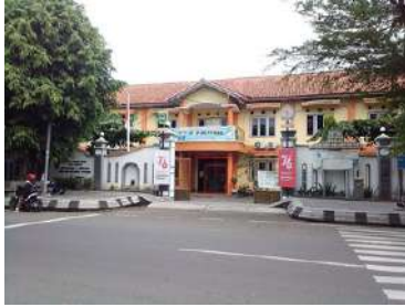
Gerbang Sekolah

SMPN 1 Ambarawa. Di depan sekolahnya banyak gerobak jajanan kaki lima. Di samping sekolah juga ada warung kecil tempat siswa sering bolos sekolah.