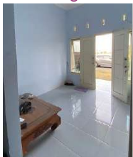
Ruang Tamu

Ruang tamunya belum terisi dengan furnitur, hanya ada tikar anyaman dan meja kecil yang sering dipakai untuk makan. Diatas meja disediakan beberapa stoples berisi kerupuk dan camilan.