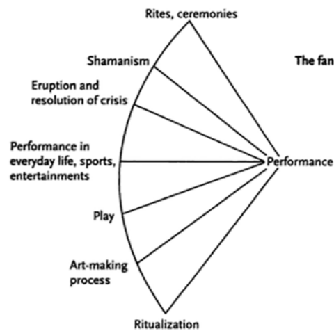
Gambar 1.1 Diagram Kipas Richard Schechner

Diagram kipas Schechner dapat digambarkan dalam bentuk uraian sebagai kipas yang bilah-bilahnya mewakili berbagai bentuk performance, misalnya: everyday life (perilaku sehari-hari), play/games (mainan, permainan), sports (olahraga), ritual (upacara, ibadah, adat), theatre/dance/music (seni pertunjukan). Bilah-bilah ini tidak terpisah tegas, melainkan saling berhubungan, menunjukkan bahwa ritual, permainan, dan teater berbagi banyak ciri performatif, misalnya pengaturan ruang, waktu, peran, dan penonton (Schechner, 2002: 7–8). Diagram kipas ini penting sebagai landasan teoritis karena membantu memposisikan suatu praktik budaya tertentu (misalnya upacara adat) di antara bentuk-bentuk performance lain, tanpa langsung menguraikan secara rinci. Dalam penelitian, diagram kipas Schechner akan menjadi kerangka untuk menempatkan objek kajian sebagai salah satu bentuk performance yang berada di persimpangan antara ritus dan pertunjukan.