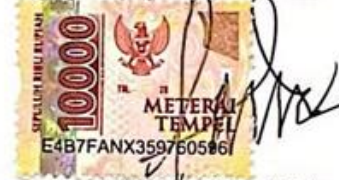
Siti Nur Kholidah