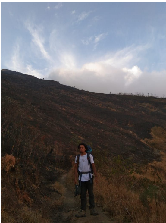
Gambar I.2 Foto pendakian penulis di Gunung Sumbing setelah terbakar akibat kemarau panjang.

makanan tetap berjalan dengan baik, apabila rantai makanan itu terputus, termasuk manusia juga akan musnah dari muka bumi. Dari alam penulis belajar betapa pentingnya alam ini untuk dijaga, hal kecil yang kadang disepelekan terkadang akan berakibat fatal, kalau bukan dimulai dari diri kita sendiri untuk menjaga alam, lalu kepada siapa lagi alam berharap pertolongan, karena manusia adalah makhluk berakal yang dapat melakukan apa saja dan berbuat baik atau buruk adalah pilihan.