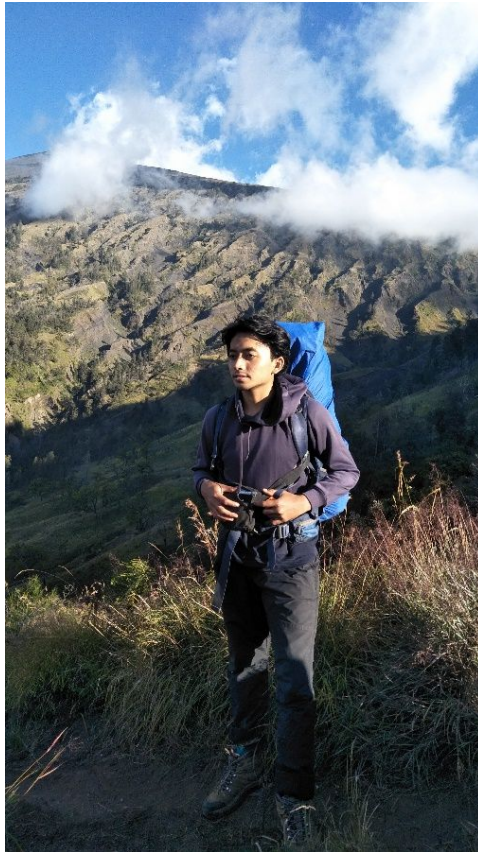
Gambar I.1 Foto pendakian penulis di Gunung Rinjani.

Ada beberapa cara yang dipakai penulis untuk lebih mendalami konsep penciptaan pada karya seni lukis-nya. Bisa dengan cara teori, seperti membaca buku, website, melihat video tentang petualangan dan sejenisnya atau belajar secara praktik dengan cara melakukan aktivitas petualangan, seperti mendaki gunung, melakukan perjalanan jauh antar pulau, menelusuri hutan, camping , bushcraft dan lainnya. Bagi penulis aktivitas tersebut saling melengkapi dan telah menjadi ilmu yang mahal, yaitu pengalaman. Petualangan adalah pengalaman atau usaha yang mengasyikan yang biasanya berani dan berisiko, petualangan sering kali dilakukan untuk menciptakan gairah