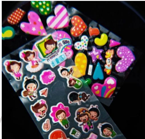
Gambar 1.1 Koleksi stiker

yang sulit dijelaskan secara rasional. Ada yang mempertahankan foto lama, surat, kartu ucapan, pakaian, atau benda-benda kecil yang secara ekonomi tidak memiliki nilai istimewa. Meski begitu, benda-benda tersebut tetap dipertahankan karena berkaitan dengan pengalaman yang dianggap bermakna. Fenomena ini menunjukkan bahwa hubungan manusia dengan suatu objek tidak selalu ditentukan oleh fungsi atau nilai materialnya, melainkan juga oleh pengalaman dan emosi yang melekat di dalamnya.