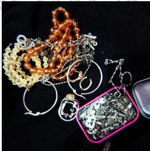
Gambar 1.2 Aksesoris

Kecenderungan menyimpan benda yang berkaitan dengan pengalaman masa lalu dikenal melalui konsep memorabilia. Istilah ini merujuk pada objek yang dipertahankan karena hubungannya dengan peristiwa, individu, atau