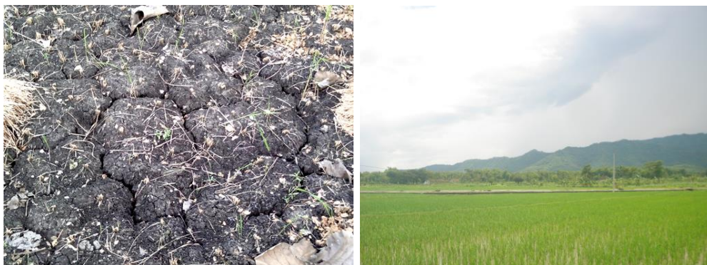
Ket. (dari kiri): Kondisi Lahan Kering dan Sawah Tadah Hujan Tanpa Irigasi