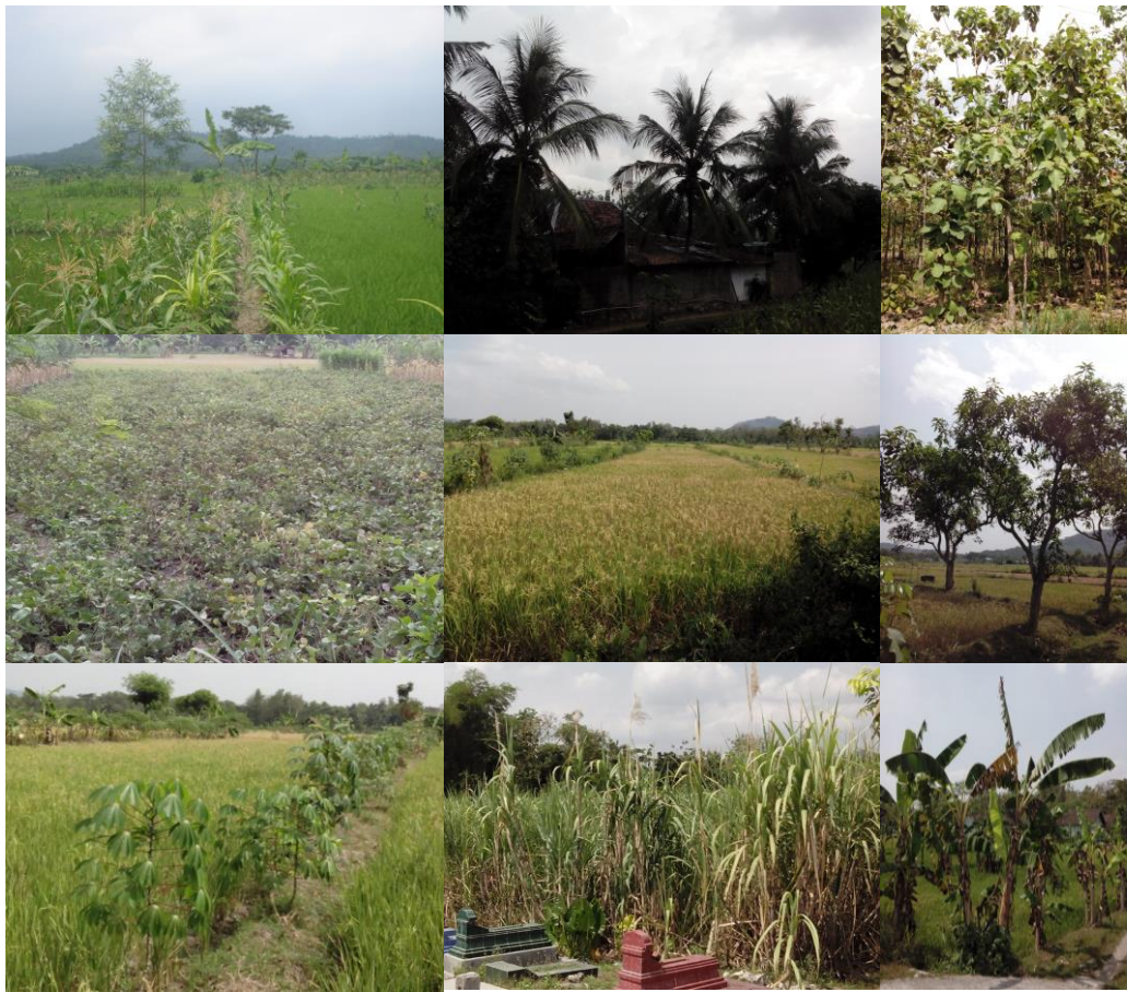
Ket. (dari kiri ke kanan): Jagung, Kelapa, Kayu Jati, Kacang Tanah, Padi, Mangga, Singkong, Tebu, dan Pisang