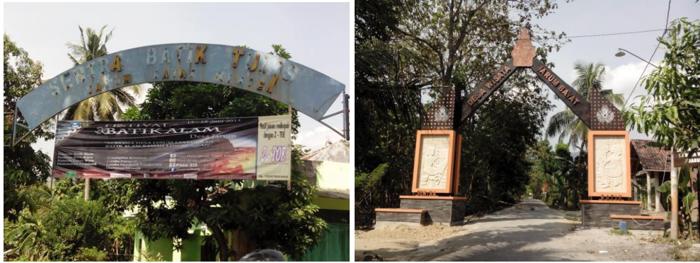
Ket. (dari kiri): Kondisi Gapura Desa Wisata Jarum Akses Jalan Raya Bayat, Gapura Baru di Bangun Berada di Dalam Desa Jarum.