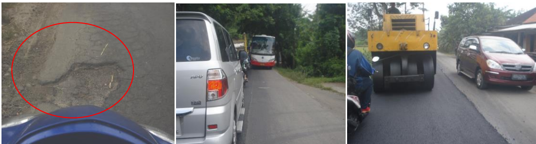
Ket. (dari kiri) : Kondisi Jalan Berlubang, Jalan Sempit untuk Kendaraan Jenis Bus Besar, Beberapa Jalan Rusak yang Sedang Diperbaiki.