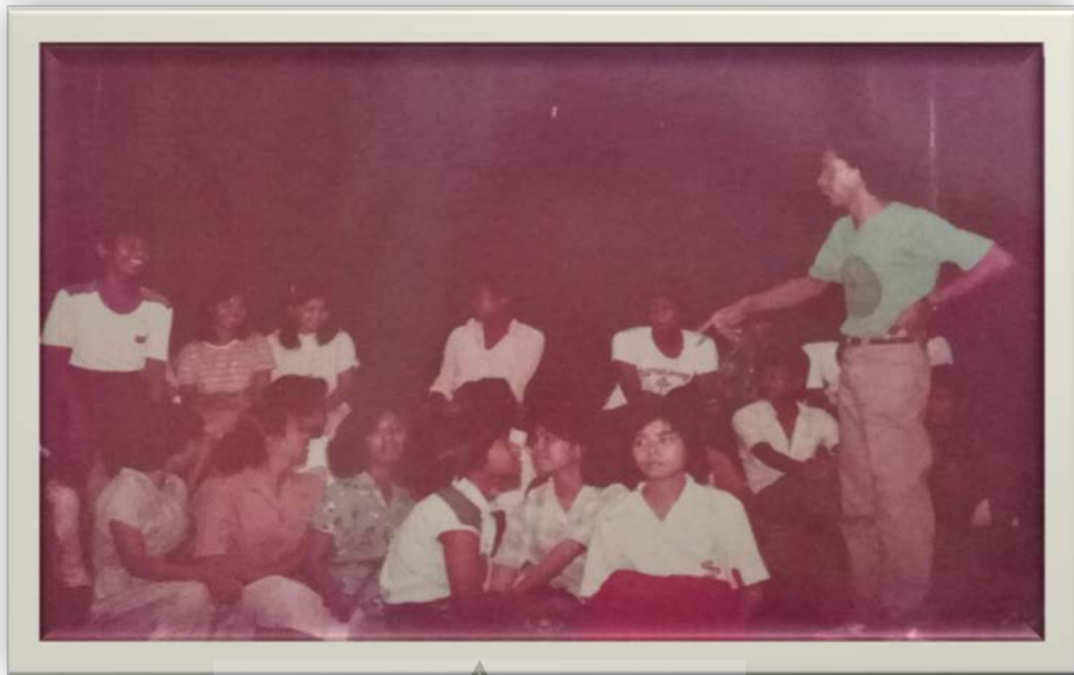
Gambar 9. Proses pengambilan gambar dan latihan lagu puisi Iqra' untuk pertunjukkan di televisi Kalimantan Timur, samarinda pada tahun 1980.