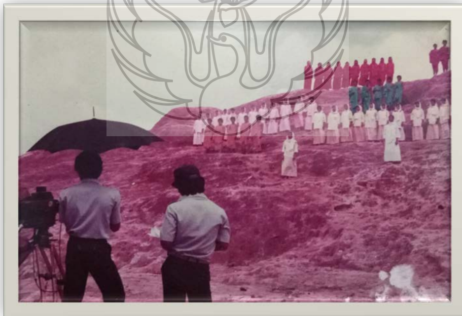
Gambar 8. Lagu puisi Iqra' di Bukit Bergiri Samarinda Kalimantan Timur