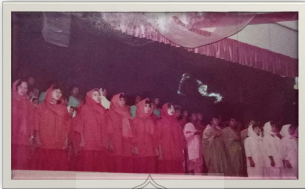
Gambar 7. Lagu puisi Iqra' di Gedung Pemuda Samarinda, Kalimantan Timur.