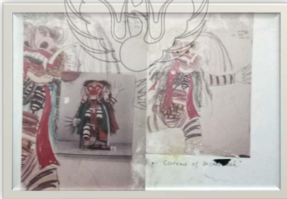
Gambar 16. Karya lukis dan kostum Boneka leak Bali, untuk Istana Boneka Dunia Fantasi- Ancol Jakarta