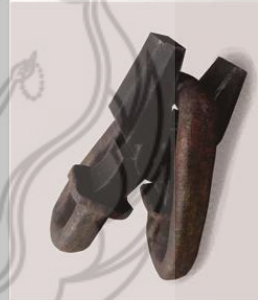
Melepas Ikatan Fiberglass, 120 x 20 x 75cm 2014