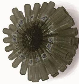
Kembang botol 72 x 72 x 36cm Botol dan kawat 2014