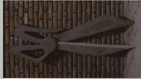
Jolie Style Scissors Fiberglass 50 x 10 x 130cm 2014