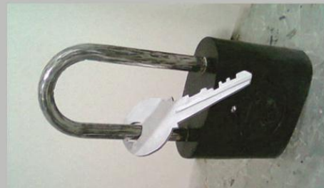
Kunci yang Terkunci Fiberglass 60 x 20 x 85 2013