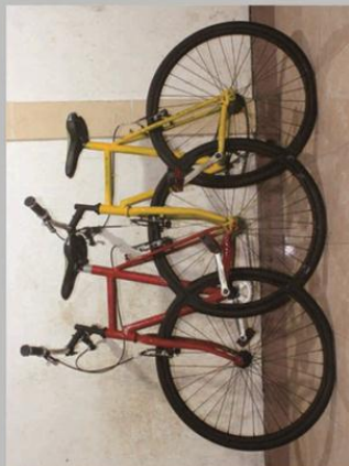
Fiktif Mixed media 60 x 20 x 85cm 2013