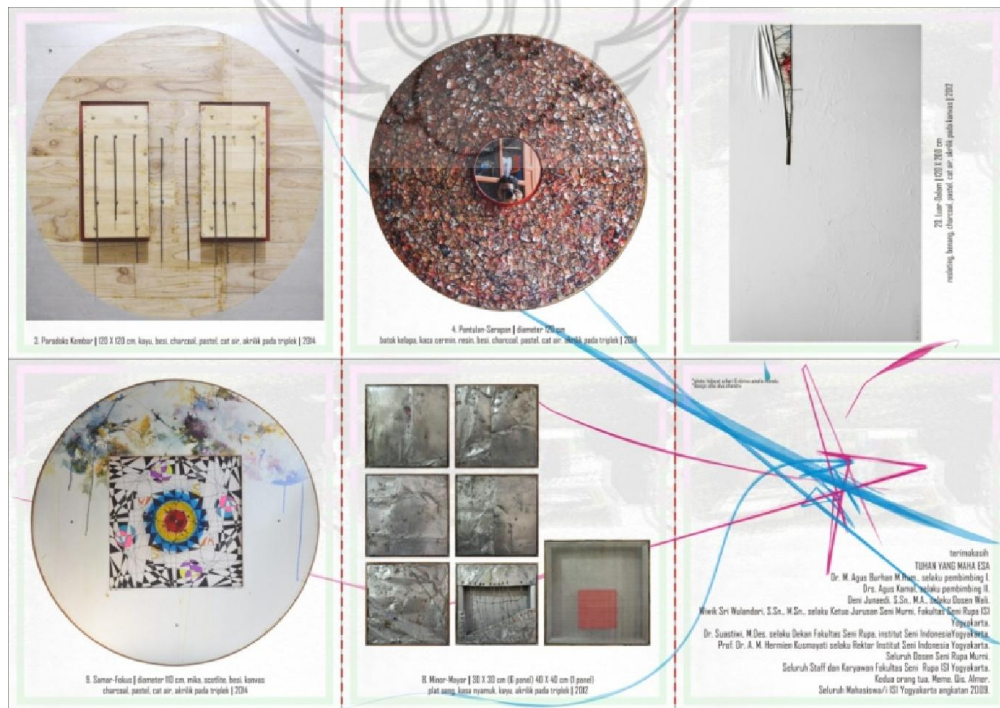
Gb. 46. Katalog pameran tampak belakang (dokumentasi penulis)