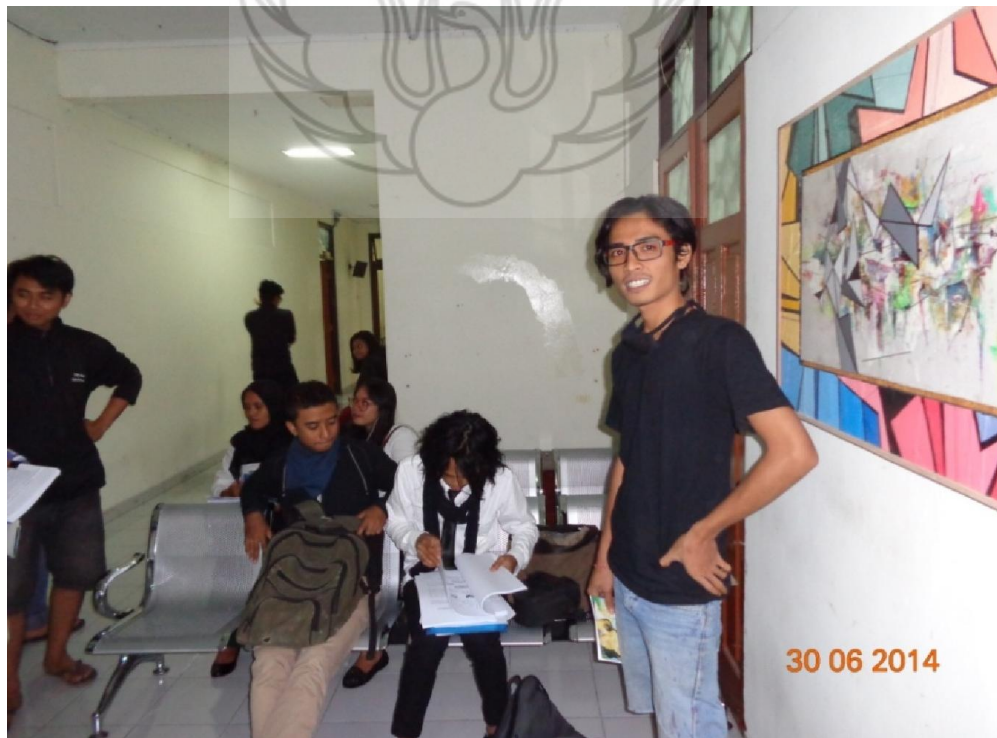
Gb. 44. Situasi Pameran