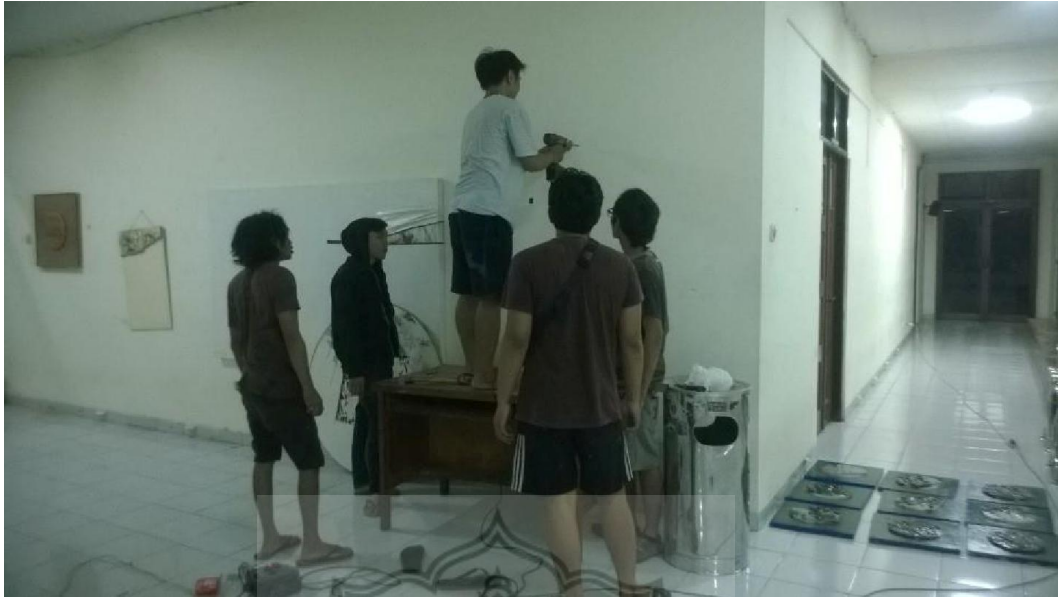
Gb. 43. Situasi display karya