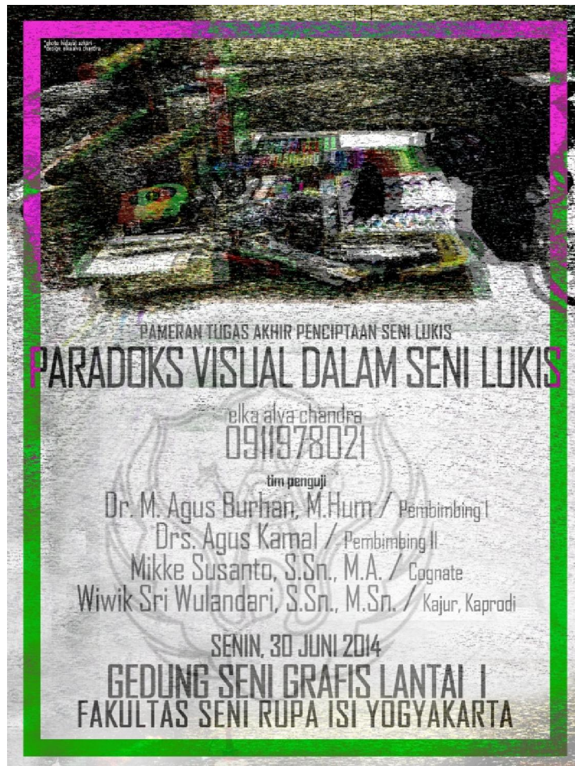
Gb. 42. Poster pameran