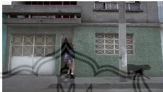
Gambar 4.2 Screenshot Scene 3. Adegan Cofi Keluar Rumah.

Pada scene 3 , tokoh utama Susana dihadirkan secara fisik ketika ia pulang kerja dan menuju rumahnya. Pada saat Susana membuka pintu, Cofi keluar dari rumah. Susana langsung mengejar Cofi dengan tujuan membawa Cofi kembali ke dalam rumah. Susana mengejar Cofi tetapi Cofi tidak mau kembali. Terpaksa Susana harus kembali ke rumah dengan tangan kosong karena tidak mendapatkan Cofi.