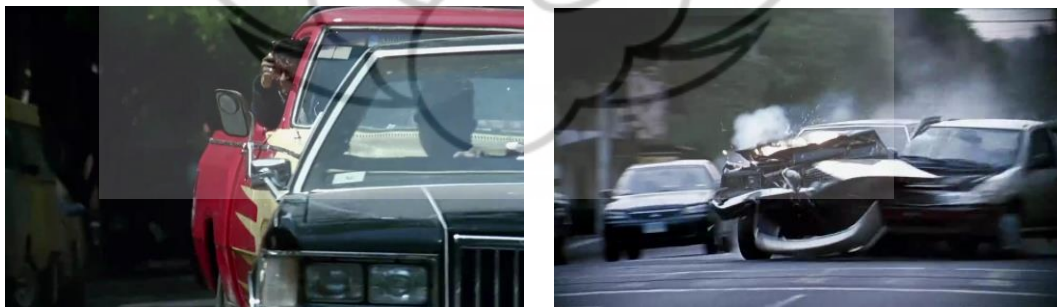
Gambar 4.1 Screenshoot Scene 1. Adegan Kejar-kejaran dan kecelakaan

Suspense sudah muncul pada scene 1 ketika adegan kejar-kejaran. Cerita bergerak sejak saat itu, penonton akan merasa tegang dan penasaran dengan ending aksi kejar-kejaran tersebut. Adegan kejar-kejaran berakhir pada peristiwa kecelakaan, ketika mobil Octavio menabrak mobil lain di depannya. Scene 1 merupakan awal in medias res yang berarti “ditengah-tengah action ” (Boggs, 1992: 36). Di mana adegan dalam film langsung disuguhkan pada kejadian menggetarkan dan penonton langsung dibuat tegang. Scene 1 mengawali cerita plot pertama “Octavio dan Susana”. Octavio dikejar oleh sebuah mobil pick up yang terus mengarahkan pistol ke arah mobil Octavio. Melihat kondisi Cofi lemah tak berdaya, Octavio berusaha keras menghindari kejaran dengan tujuan membawa dan menyelamatkan Cofi. Adegan kejar-kejaran, menimbulkan perasaan harap-harap cemas dan menegangkan.