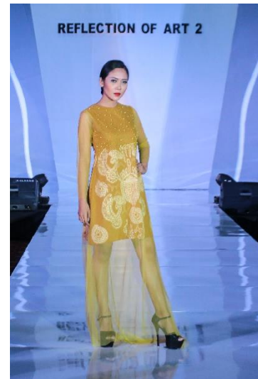
Gambar 9. An Balance of Mandalika