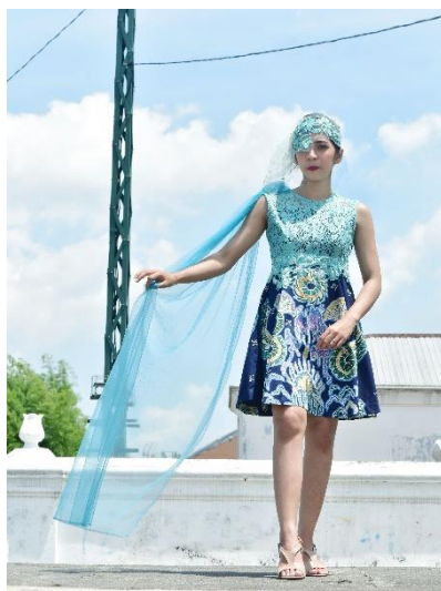
Gambar 6. Segar of Mandalika

Penulis dalam penciptaan Tugas Akhir ini mengambil inspirasi dari Legenda Nyale , salah satu heritage Lombok yang menurut kepercayaan merupakan jelmaan Putri Mandalika . Inspirasi yang diambil dalam pembuatan karya lebih kepada bentuk Nyale yang divisualisasikan ke dalam motif batik Sawat Mandalika yang diwujudkan dalam busana Cocktail . Motif batik Sawat Mandalika adalah penciptaan motif dengan sumber ide yang berasal dari Legenda Nyale dan Semen Sawat atau sayap. Terdapat delapan rancangan yang semuanya berupa busana Cocktail dengan rok siluet A-Line dan I-Line dengan paduan warna yang bervariasi.