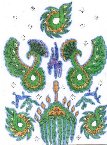
Gambar 4. Motif Batik Sawat Mandalika