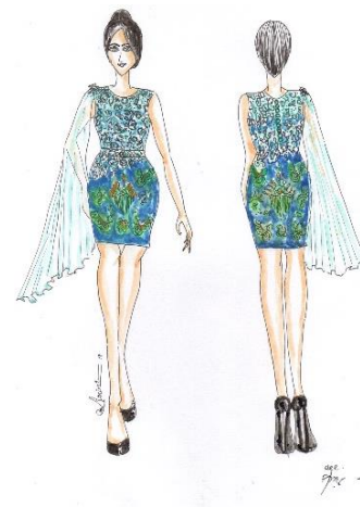
Gambar 5. Desain Busana Cocktail