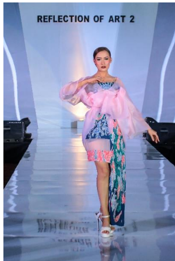
Gambar 8. Girlie of Mandalika