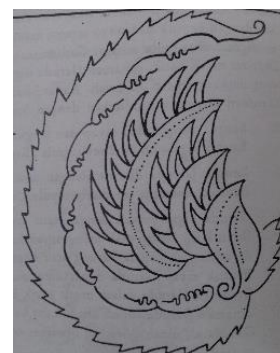
Gambar 2. Motif Sawat Garuda