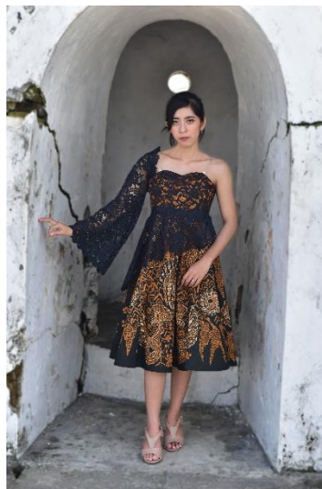
Gambar 10. All of Legend