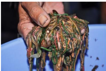
Gambar 1. Nyale (Sumber : www.academia.edu /Dian Putriana S, 2017)