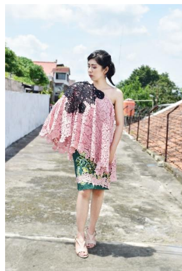
Gambar 7. Kuta of Mandalika