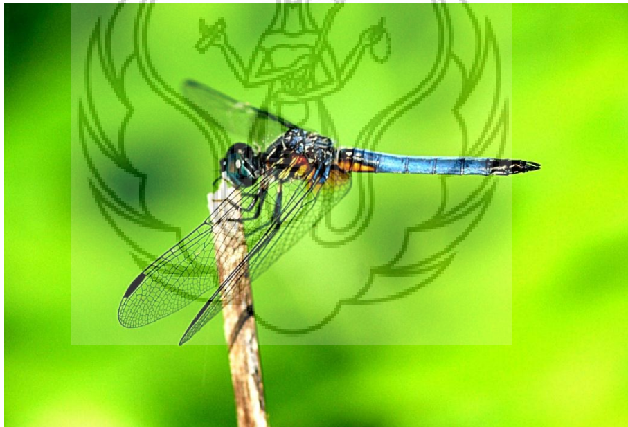
Gambar 48 : Capung