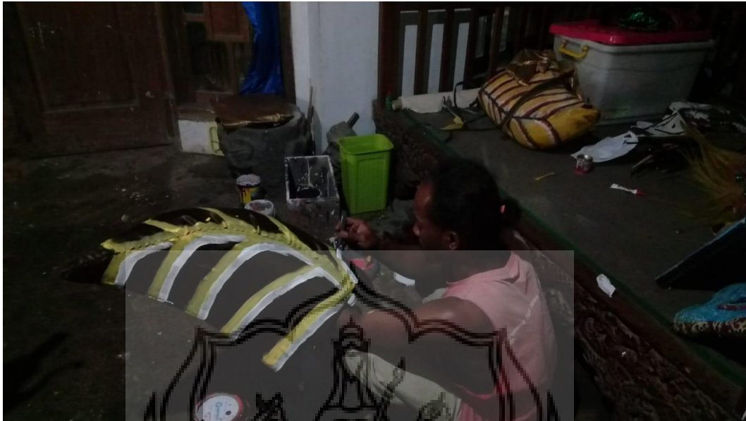
Gambar 52 : Proses pembuatan Bokongan