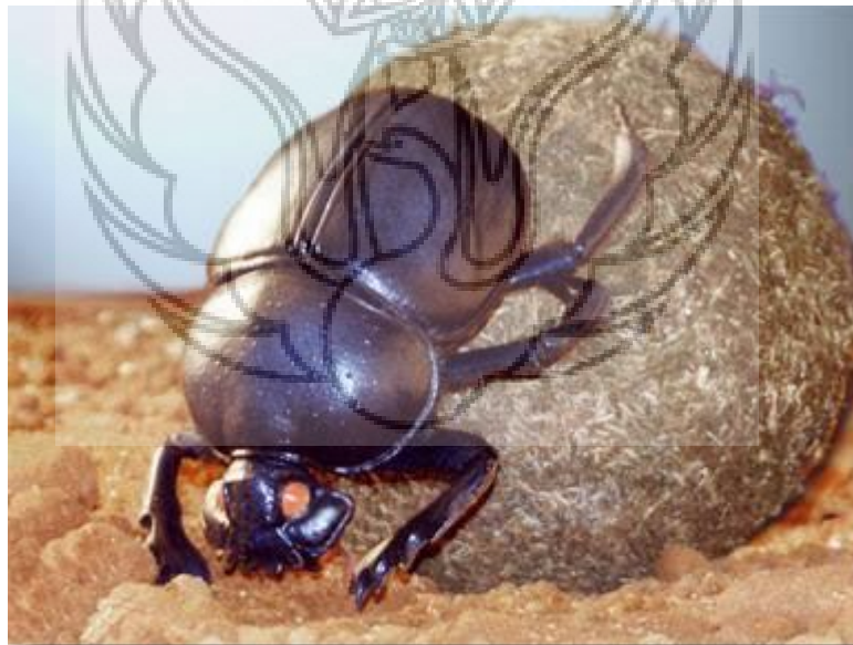
Gambar 50 : Kutis