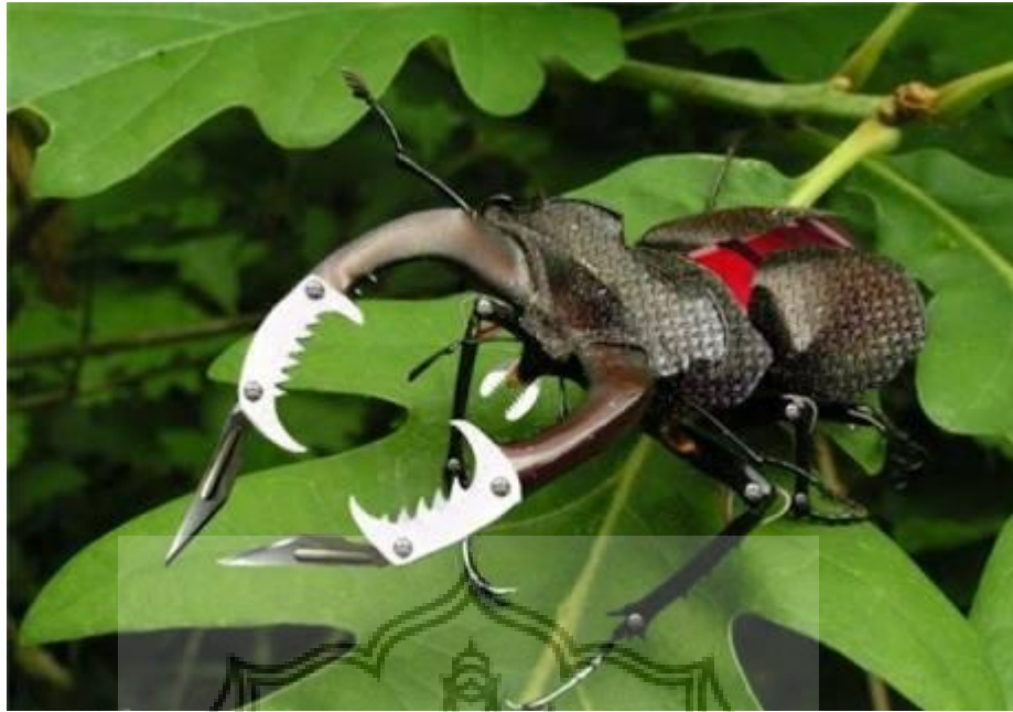
Gambar 51 : Ogok-ogok