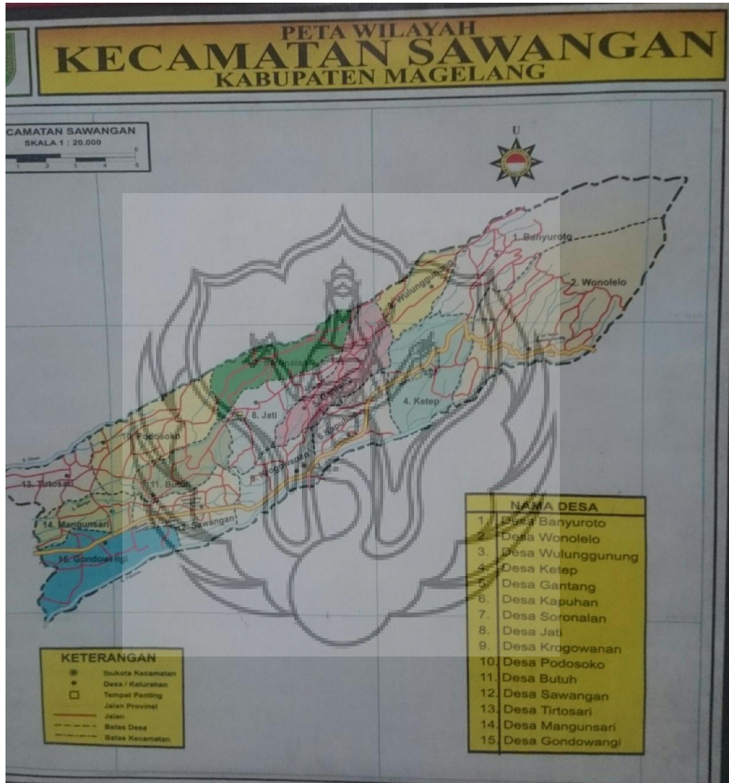
Gambar 43 : Foto peta kecamatan Sawangan (Foto : Anton Prabowo, 20 April 2018)