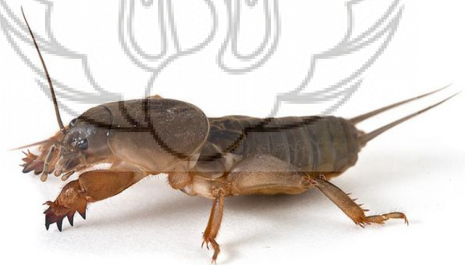
Gambar 46 : Orong-orong