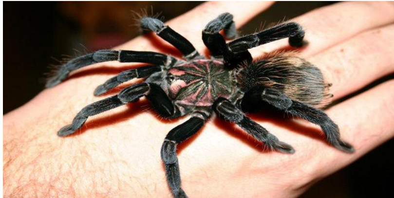
Gambar 47 : Laba-laba

Foto di unduh di https://filetanyoe.files.wordpress.com/2014/10/laba-laba-xenesthis-immanis-raksasa.jpg pada tanggal 5 mei 2018