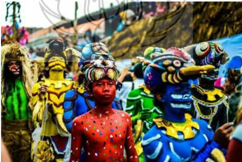
Gambar 53 : pentas Topeng Saujana