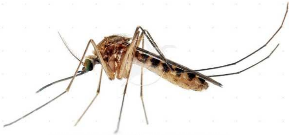
Gambar 49 : Nyamuk

Foto diunduh di https://www.google.com/search pada tanggal 5 mei 2018