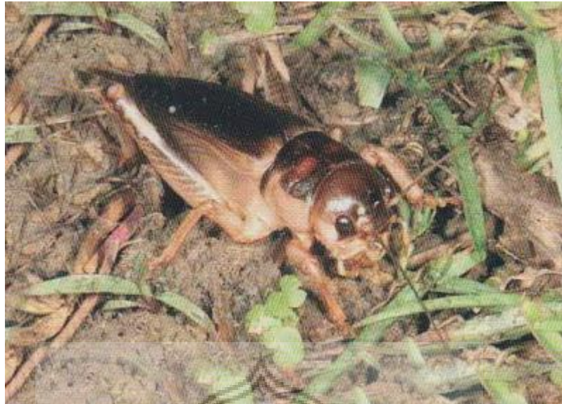
Gambar 45 : Gangsir