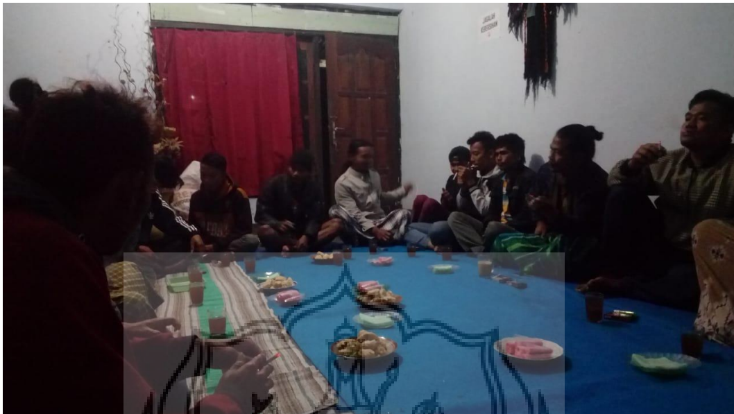
Gambar 54 : rapat pembahasan pentas