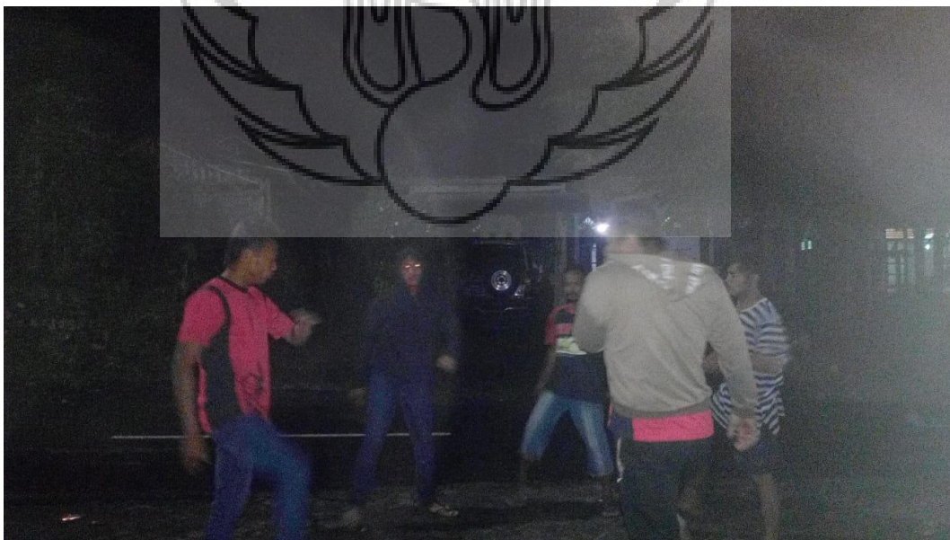
Gambar 55 : Latihan Topeng Saujana