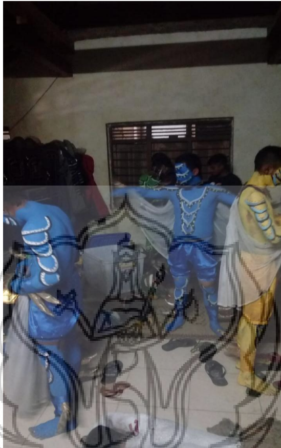
Gambar 56 : Persiapan Pentas