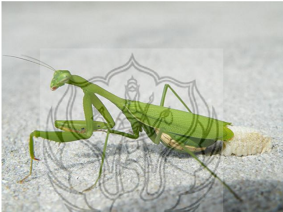
Gambar 44 : Belalang Sembah