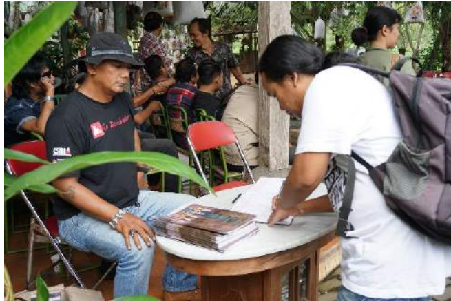
Gambar 4. Pembagian Katalog Untuk Pengunjung Saat Pengisian Buku Tamu.

lebih dari 1000 katalog Abstract Party , menurut Umar Chusaeni lebih baik katalog berlebih daripada kehabisan katalog. Pembagian katalog ini dibagikan kepada seluruh pengunjung tanpa ada pengecualian.