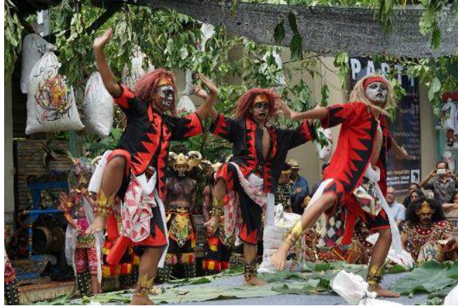
Gambar 2. Penampilan Kesenian Jingkrak Sundang.