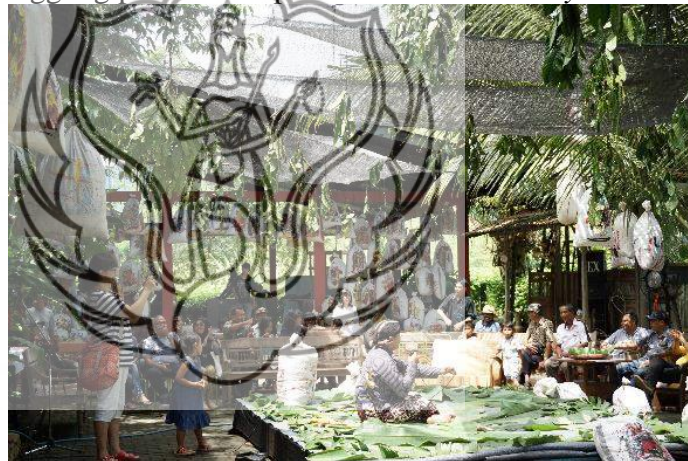
Gambar 1. Dekorasi Panggung Pembukaan.

Dalam penyajian dekorasi panggung Limanjawi dan tim KSBI 15 menyajikan dekorasi yang berbeda. Dekorasi panggung disesuaikan dengan konsep pameran yaitu abstrak. Bahan yang digunakan seperti karung beras yang digambar abstrak oleh KSBI 15, daun-daunan, dan jerami serta alat-alat gamelan. Dekorasi luar ini penting karena hal ini visual yang pertama kali dilihat oleh para pengunjung ataupun wisatawan. Berikut gambar dekorasi panggung pembukaan pameran Abstract Party :