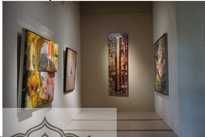
Gambar 3. Karya Di Pameran Abstract Party Borobudur Today 2018 .

Produk nyata dalam pameran abstract party ini adalah karya-karya yang ditampilkan pada pameran Abstract Party . Produk yang dipasarkan memiliki bentuk yang berupa lukisan, patung dan digital printing . Seluruh karya yang ditampilkan beraliran abstrak yang sesuai dengan tema pameran ini. Kualitas karya yang ditampilkan sangat baik, hal ini karena karya dihasilkan oleh seniman-seniman yang profesional. Jumlah karya yang disajikan dalam pameran Abstract Party ini ada 29 karya, yaitu 4 karya patung, 1 karya digital printing , dan 24 sisanya adalah lukisan.