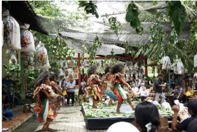
Gambar 7. Suasana Pertunjukan Tari Jingkrak Dalam Pembukaan Pameran Abstract Party .