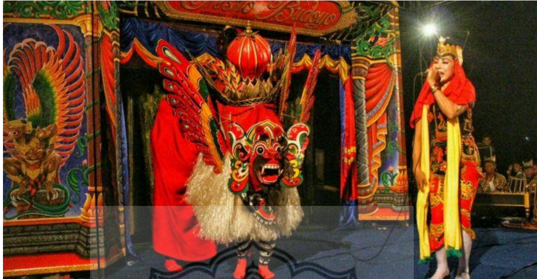
Gambar 1. Pementasan Barong Using Sanggar Tresno Budoyo (Sony, 2017)