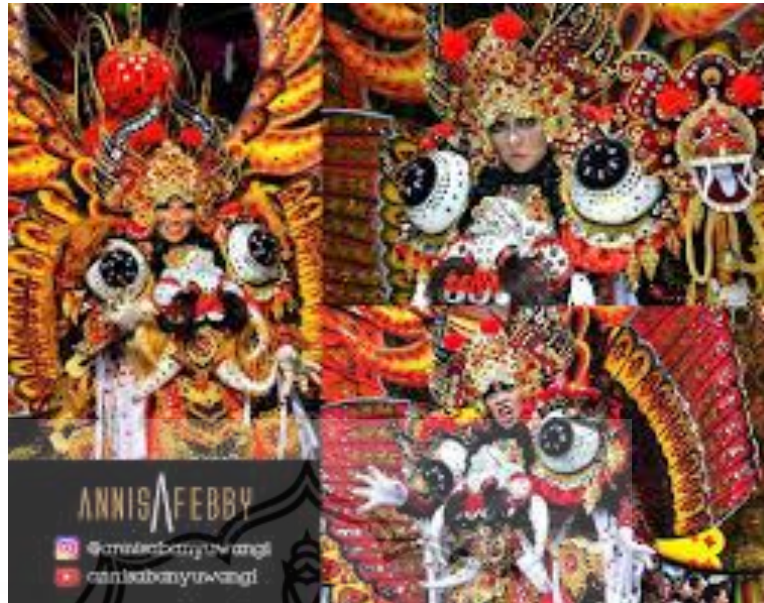
Gambar 2. Barong Using acara ,Banyuwangi Etno Carnival 2012 (share_sheet&igshid=btb5ze8ynypa)

Dalam menciptakan kostum penulis akan membuat kostum lebih ringan dan lebih fleksibel dengan tujuan agar saat digunakan aktor dalam pementasan dapat digerakan lebih mudah dan memunculkan image lebih hidup.