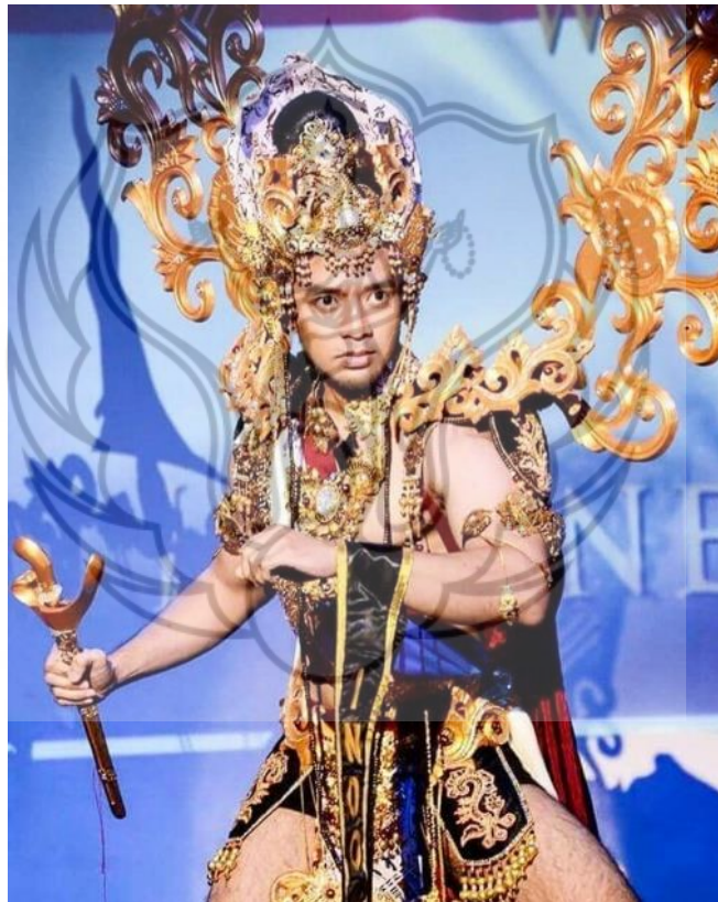
Gambar 3: Kostum Sidopekso ajang Mister Culture World 2017 (Langgeng.2017)

Pada kostum Sidopekso ini menjadi sumber ide dan referensi untuk menciptakan kostum Barong Sunar Udara dalam pertunjukan Barong Using , khususnya dari segi cara pemilihan warna, pemilihan bahan dan cara menggabungkan unsur tradisi dan modernnya.