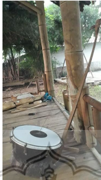
Gambar 2 : Alat Musik Belentung Panggede

Belentung panggede merupakan jenis belentung yang paling besar daripada bentuk lainnya. Fungsi belentung panggede dalam ansambel belentung adalah sebagai pengganti bunyi bas karena bunyi yang dihasilkan belentung panggede merupakan frekuensi bunyi yang paling bawah atau rendah ( low frequency ).