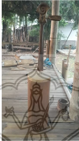
Gambar 3 : Alat Musik Belentung Panungtun

Belentung panungtun memiliki diameter awak yang cukup besar di dalam ansambelnya, yaitu dengan ukuran diameter awak 14,5 cm, tinggi awak 37 cm, panjang catang 56 cm, dan panjang catang panekuk 22 cm. Sesuai dengan namanya “ panungtun ”, maka fungsinya dalam ansambel belentung adalah untuk menuntun permainan musik belentung lainnya agar ada kesesuaian tempo antara satu dengan lainnya serta menjaga agar bentuk lagu dan pola permainan saling berkesinambungan.