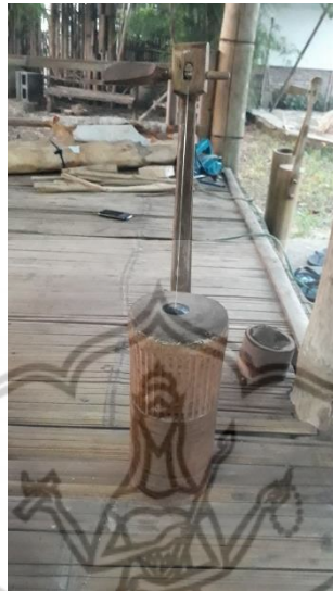
Gambar 4 : Alat Musik Belentung Panembal

Belentung panembal ini biasanya merupakan belentung yang berukuran kecil dengan diameter antara 11 cm, tinggi awak 26,5 cm, panjang catang 35 cm dan panjang catang panekuk 22 cm. Biasanya terdapat dua sampai tiga belentung panembal dalam satu ansambel dan dimainkan dengan saling mengisi atau saling mengimbal.