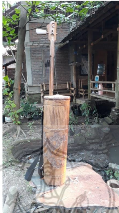
Gambar V=5 : Alat Musik Belentung Pangrecok

Fungsi belentung pangrecok adalah untuk memberikan ornamentasi-ornamentasi atau variasi-variasi dalam ansambel ini. Pola permainannya lebih bebas daripada belentung yang lainnya. Belentung ini berukuran cukup besar dibandingkan yang lainnya, memiliki diameter 19 cm, tinggi awak 90 cm, panjang catang 1 m dan panjang catang panekuk 35 cm. Salah satu contoh pola ritme yang dimainkan pada belentung pangrecok :