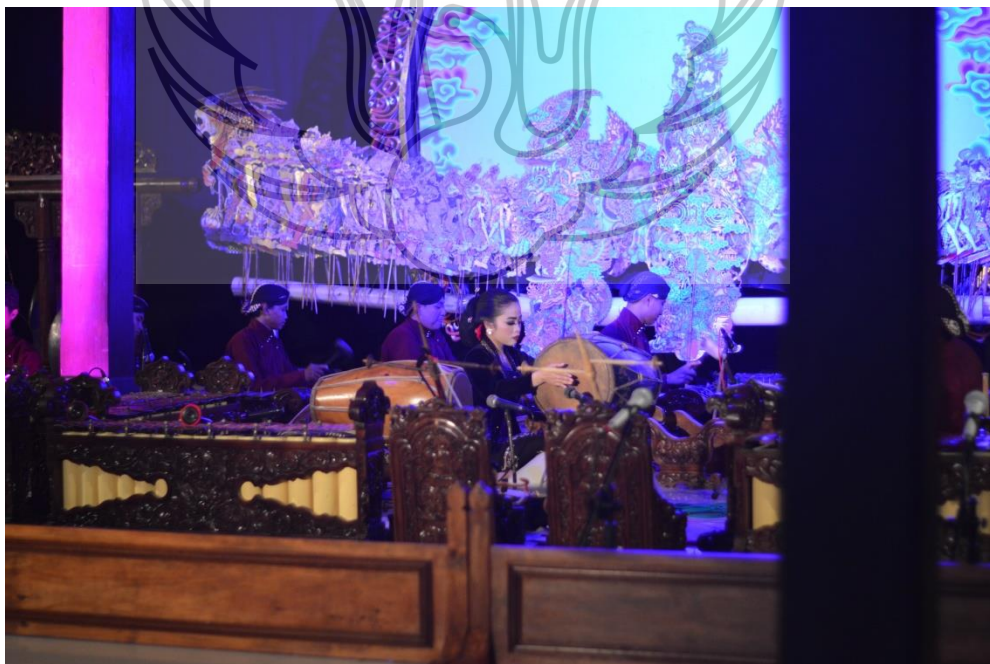
Gambar 8. Penyajian gending soran