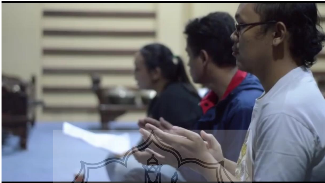
Gambar 5. Proses Latihan