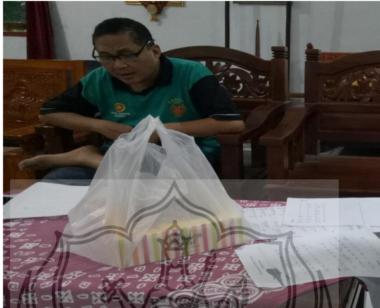
Gambar 1. Wawancara mengenai garap Gending Sledreng