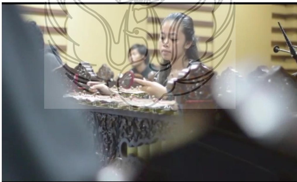
Gambar 4. Ujian Kelayakan