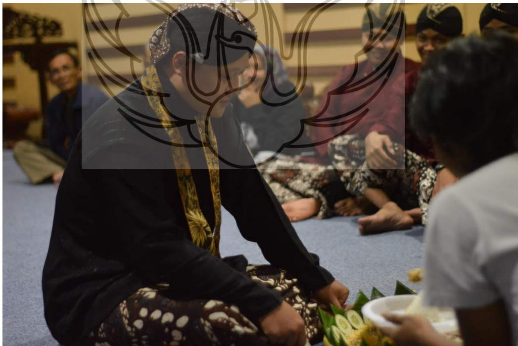
Gambar 6. Acara tumpengan sebelum ujian