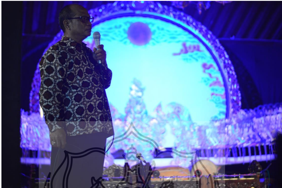
Gambar 7. Sambutan Ketua Jurusan Karawitan