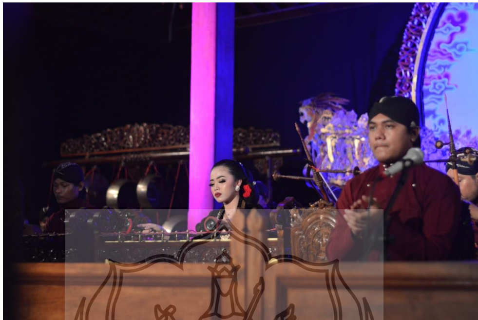
Gambar 9. Penyaji gender Gending Sledreng