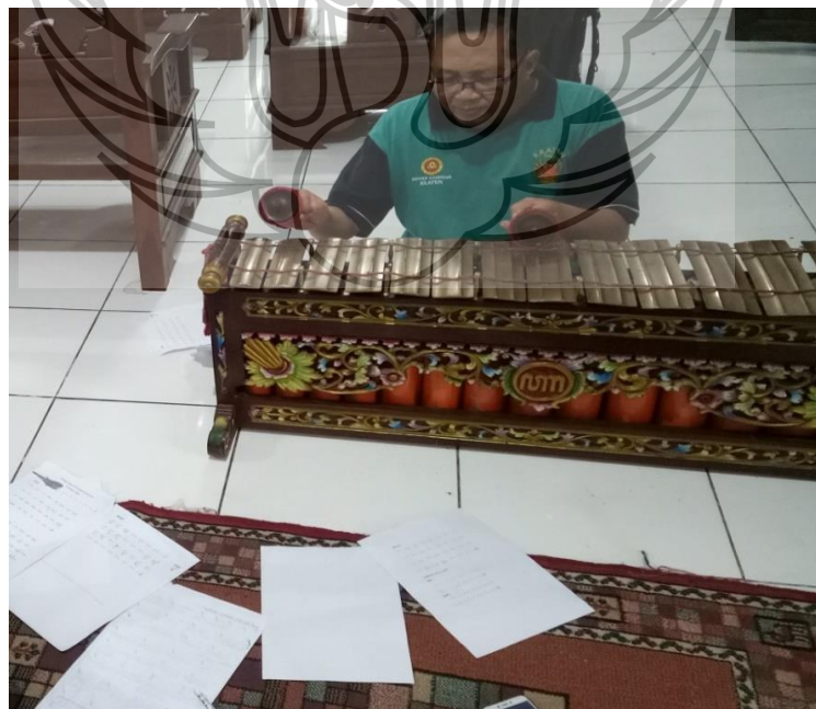
Gambar 2. Proses mencari garap rebab dan gender