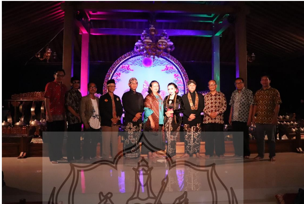
Gambar 13. Penyaji bersama dosen Penguji setelah ujian pementasan