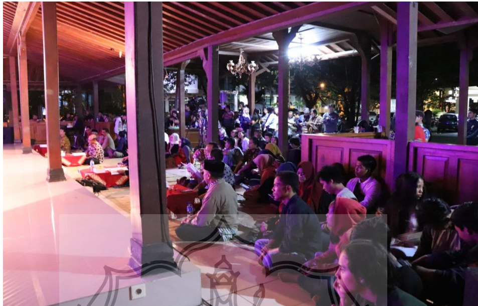
Gambar 11. Suasana ujian pementasan