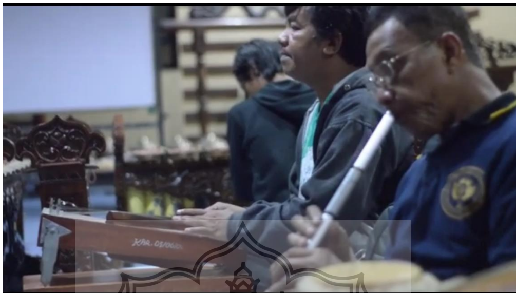
Gambar 3. Proses Latihan