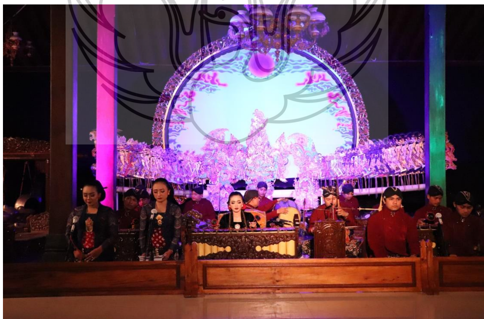
Gambar 10. Tugas Akhir Penyajian Karawitan Gending Sledreng (Foto: Muhammad Eko, 2019)