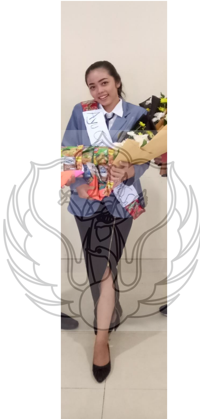
Gambar 15. Penyaji setelah ujian pendadaran