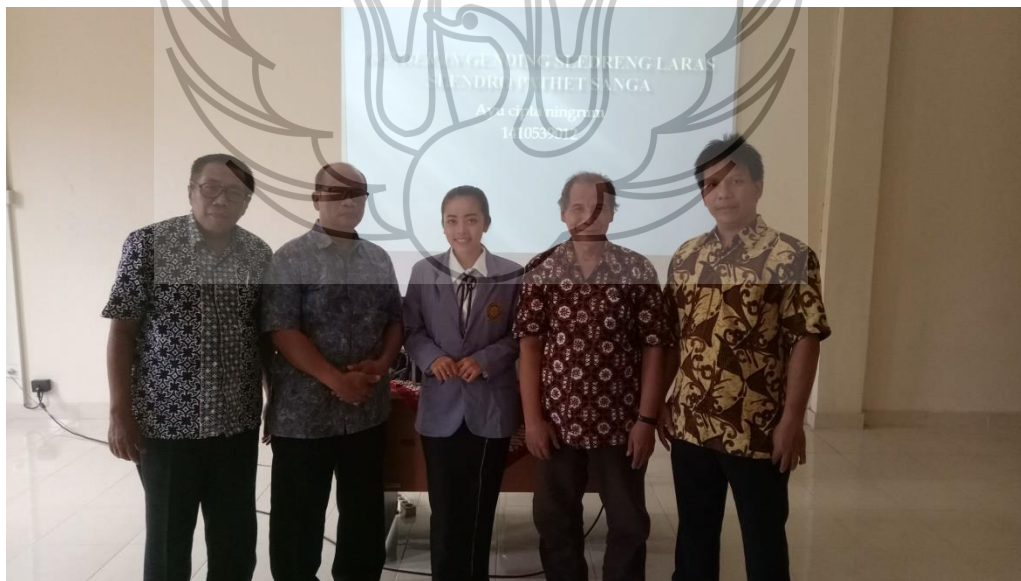
Gambar 14. Ujian pendadaran