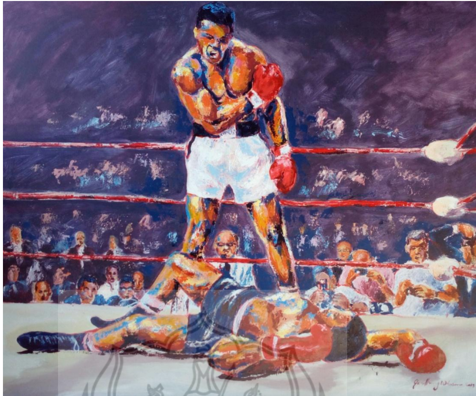
Gambar. 3 Bangun dan Bertarunglah Cat akrilik pada kanvas 100 x 120 cm 2019

(mengacu pada foto yang diabadikan oleh fotografer Neil Leifer)