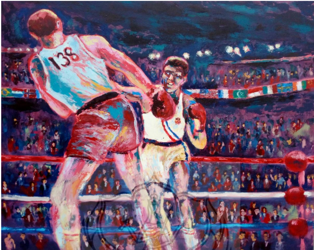
Gambar 1 Olimpiade Roma 1960 Cat Akrilik Pada Kanvas 100 x 80 cm 2018