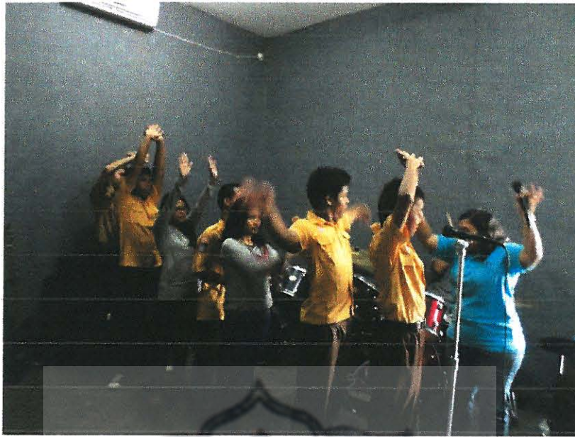
Latihan di studio musik untuk gerak dan lagu. Dok. Pribadi (2014)