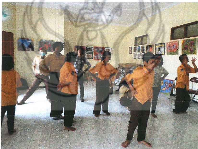
Menirukan dan mengikuti instruksi. Setiap anak berbeda menangkap gerakan yang diperagakan.