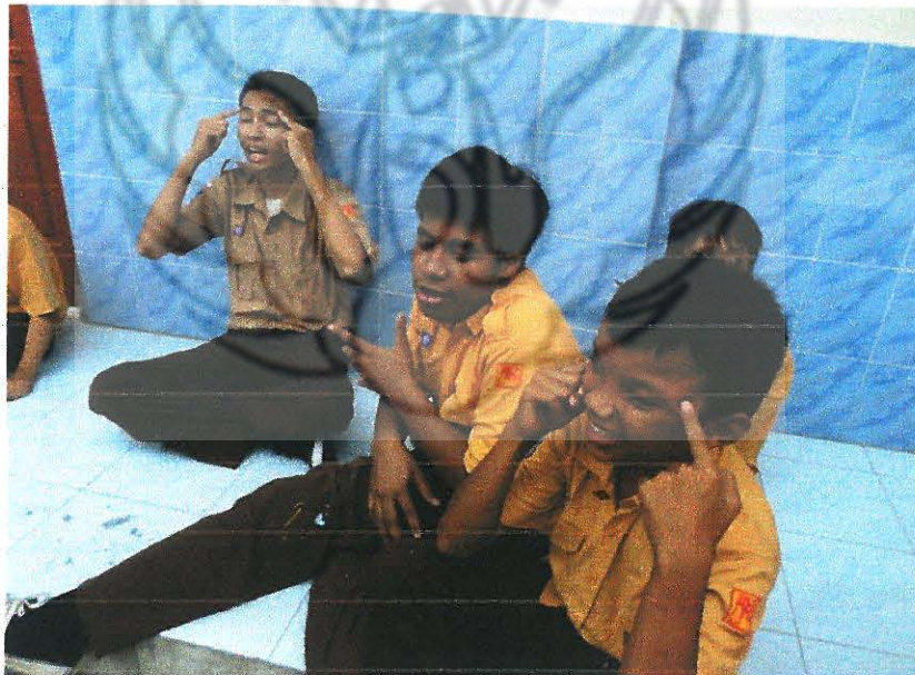
Latihan di luar ruangan. Setelah bermain petak umpet berlatih gerak dan lagu. Dok. Pribadi (2014)