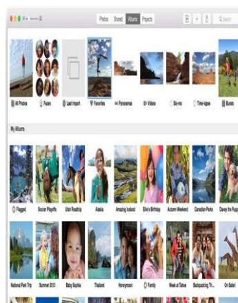
Photo dapat mengatur album berdasarkan cara pengambilan gambar(The Verge) Kemudian ada juga perubahan pada bagian shared Activity View berubah jadi lebih mirip sebuah log , seperti pada iOS. Perubahan utama pada tampilan ini ada setiap album yang dibagikan kepada teman akan tampil di daftar utama, tidak lagi tersembunyi.

Seperti dilansir KompasTekno dari The Verge , Kamis (9/4/2015), perubahan pada persoalan pengaturan foto membuat pengguna bisa menyortir foto berdasarkan cara pengambilan gambar. Misalnya panoramics , burst shot , slow motion dan timelapse video .