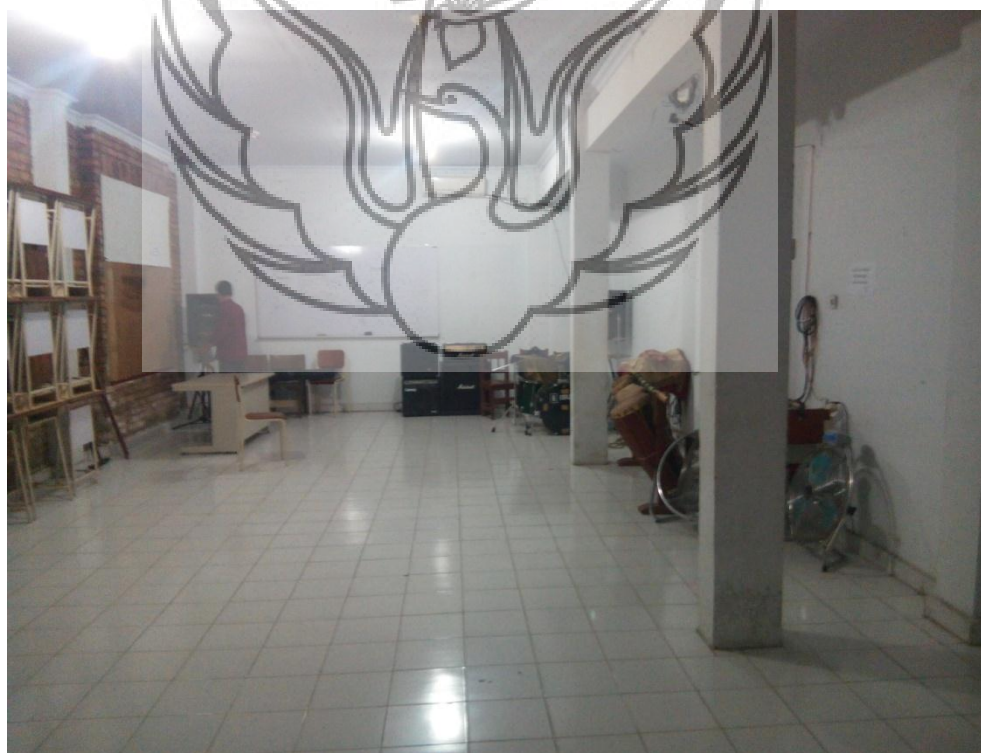
Aula tempat latihan orkes kombo dan ensamble