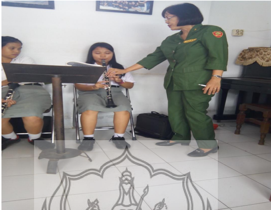
Pelajaran praktik di ruang praktik klarinet