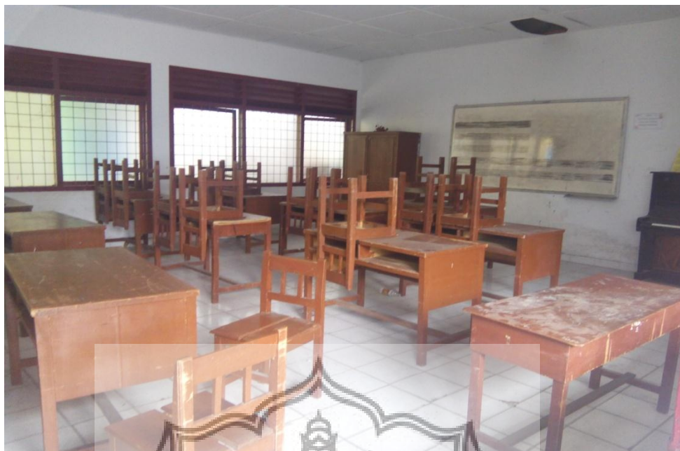
Ruangan kelas untuk proses belajar-mengajar