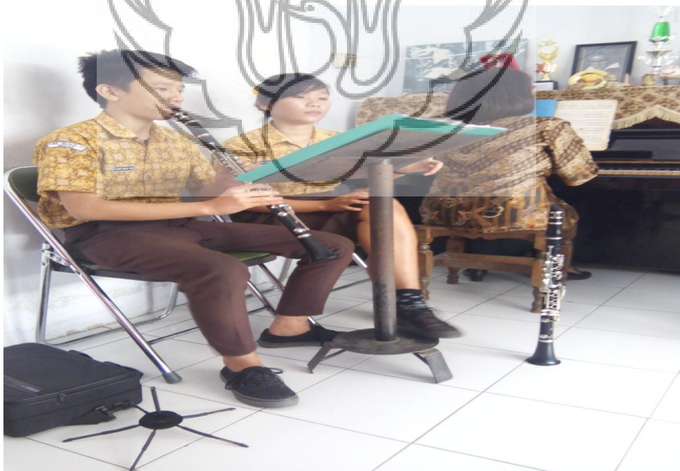
Latihan iringan lagu dengan guru peraktik