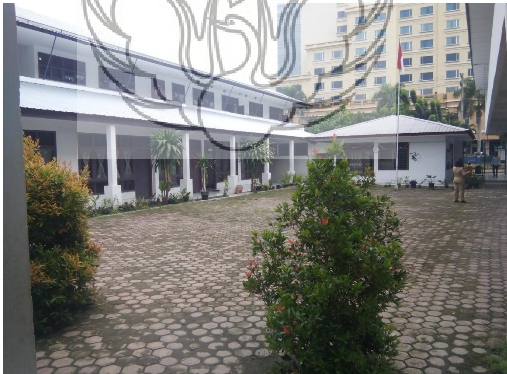
Halaman dalam sekolah