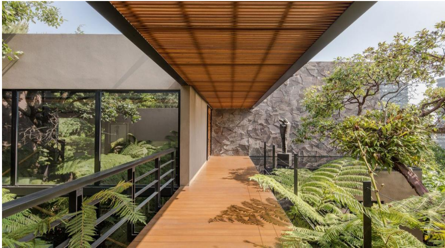
Biro Arsitek Chain + Siman Merancang Bagian Luar (Outdoor) dan Bagian Dalam (Indoor) Seolah Menjadi Satu