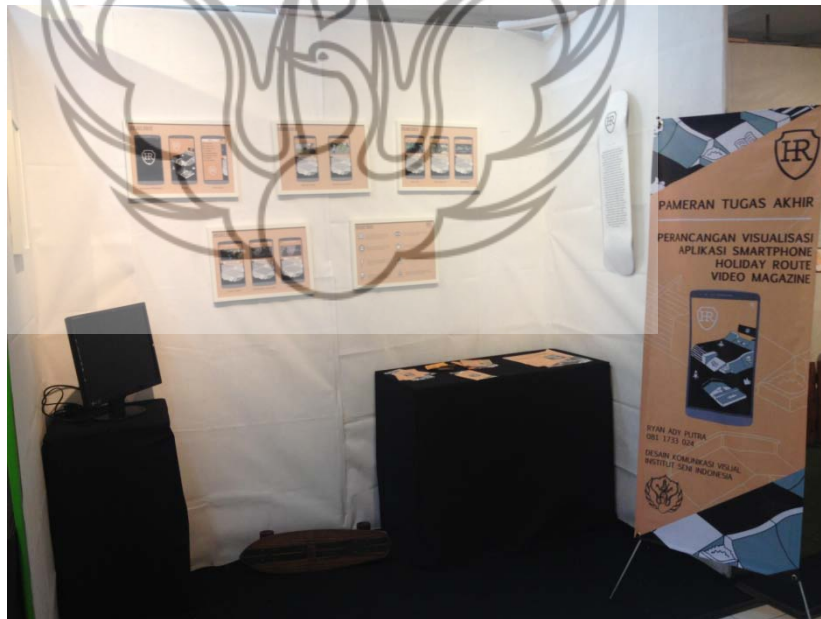
Dokumentasi Foto Pameran