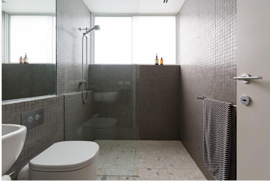
Keramik teraso selalu disukai

dan akan tetap menjadi favorit banyak orang di tahun 2020