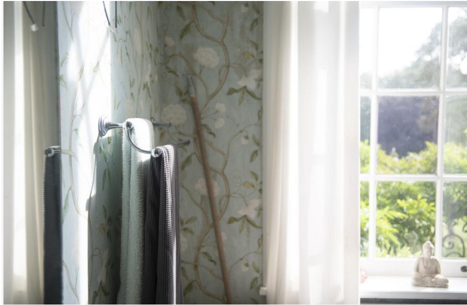
Memasang wallpaper pada dinding kamar mandi bisa menjadi pilihan tepat di tahun 2020

Pelapis geometri dan 3D memakan biaya cukup mahal. Jika kamu mencari solusi yang lebih ekonomis, memasang wallpaper pada dinding kamar mandi bisa menjadi pilihan tepat. Yang pasti, jangan lupa memastikan wallpaper tersebut anti air.