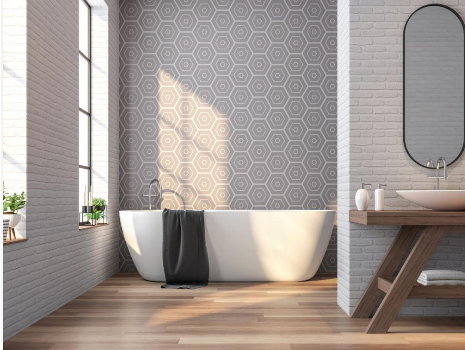
Pola dinding geometri

diperkirakan akan menjadi tren di tahun 2020