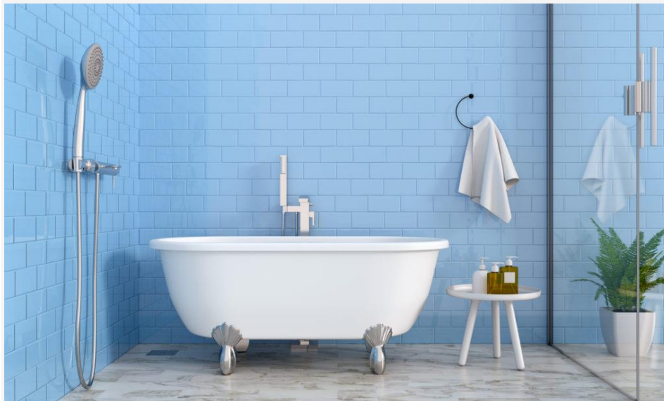
Sentuhan warna biru cerah,

bisa jadi alternatif pengganti untuk warna putih