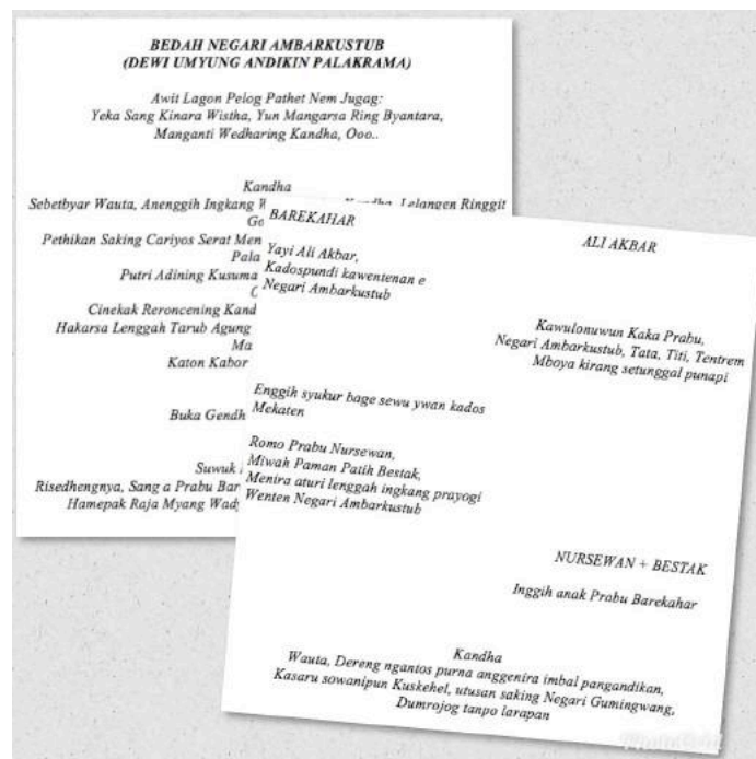
Gambar 1. Deskripsi Naskah wayang golek menak lampahan "Bedhahing Ambarkustub" pada adegan I

Dalam suatu kesempatan wawancara dengan Supriyanto selaku sutradara dalam pementasan wayang golek menak lakon Bedhahing Ambarkustub , penulis memperoleh paparan mengenai interpretasi karakter dan suasana pada setiap adegan yang menjadi acuan dalam olah garap iringan tari wayang golek menak tersebut. Lakon Bedhahing Ambarkustub versi YPBSM merupakan adaptasi dari paparan cerita golek menak versi Ki Narto, seorang dalang wayang golek menak asal dari Kebumen, Jawa Tengah, selaku narasumber dalam produksi lakon tersebut. Penata iringan mengacu pada naskah yang diadaptasikan kembali oleh Supriyanto atas dasar pertimbangan pemenuhan kebutuhan dinamika adegan menurut interpretasi kolektif tim kreatif YPBS. Setiap adegan yang tertulis dalam naskah telah dilengkapi dengan urutan adegan, gambaran suasana adegan, sasmita gending yang mendukung suasana, dialog serta keterangan lampah secara detail. Sehingga dalam proses produksi wayang golek menak ini, penata iringan harus titis dalam menafsirkan sasmita , suasana adegan dan karakter gendingnya. Berikut ini adalah deskripsi naskah yang mengilustrasikan adegan pertama dalam wayang golek menak lakon Bedhahing Ambarkustub atau Bedhah Negari Ambarkustub produksi YPBSM dalam Festival Wayang Wong Menak pada tahun 2018: