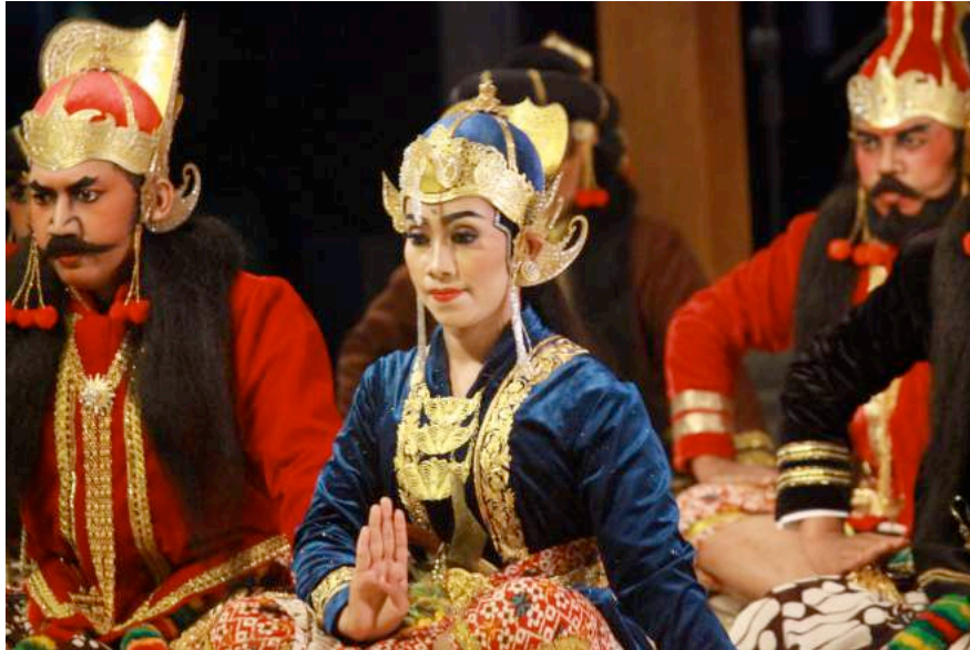
Gambar 2. Salah satu adegan dalam jejer Ambarkustub