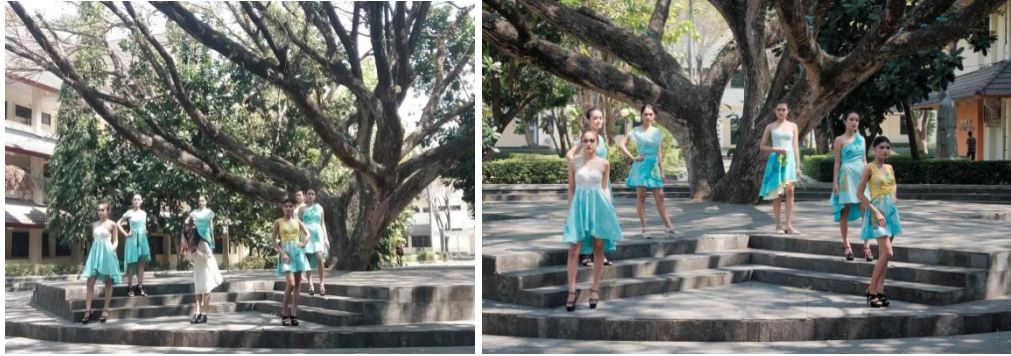
Foto Fashion Show Tugas Akhir