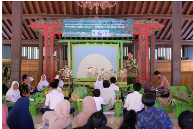
Gambar 7. Evaluasi pementasan wayang pendidikan nasional oleh peneliti (Foto: Bayu AS, 2018).