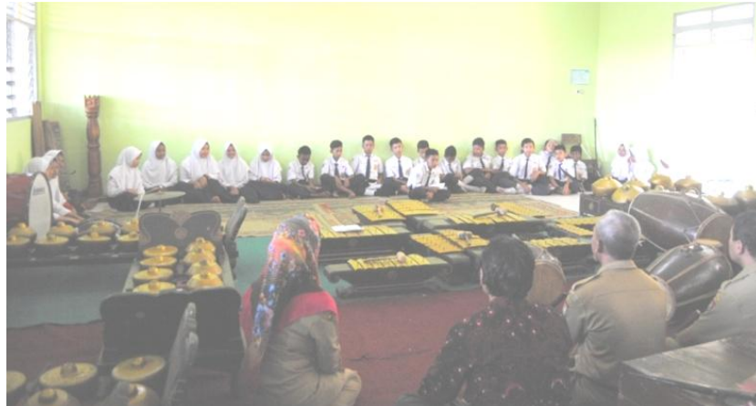
Gambar 3. Sosialisasi Wayang Pendidikan Nasional di lingkungan lembaga pendidikan formal.