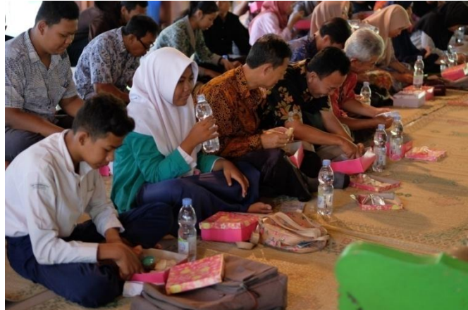
Gambar 6. Peserta kegiatan sosialisasi wayang pendidikan nasional terdiri guru dan siswa-siswi SMP, mahasiswa, seniman, pengrajin, dan pengusaha (Foto: Bayu AS, 2018).