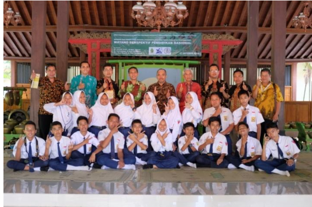
Gambar 9. Tim wayang pendidikan nasional dari SMP Negeri 1 Limbangan, Kendal, Jawa Tengah didampingi oleh peneliti, pengelola sanggar Walisanga, pembina, dewan komite sekolah, guru, dan pengusaha.