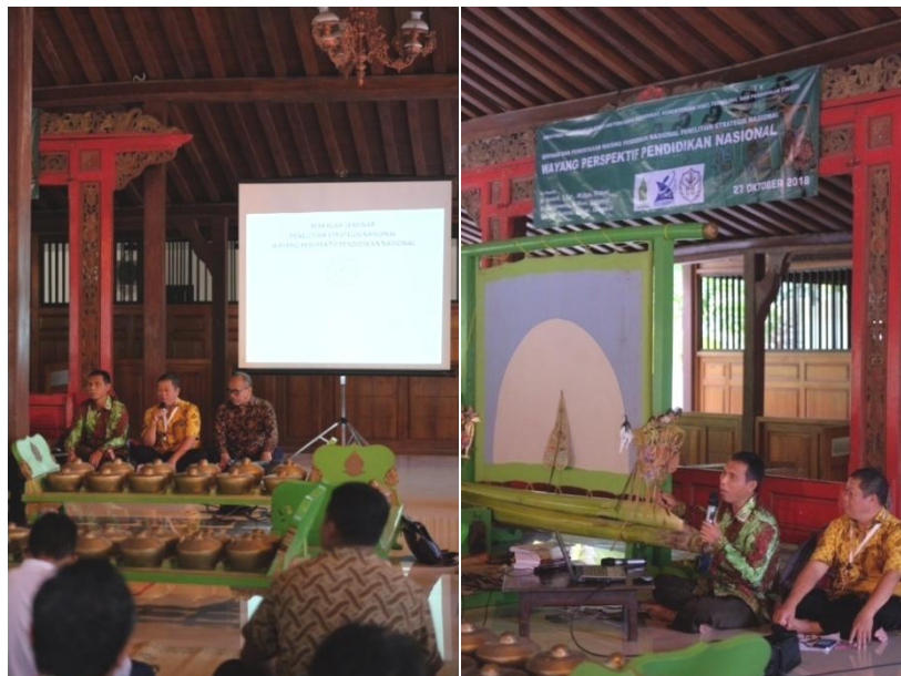
Gambar 4. Sosialisasi Wayang Pendidikan Nasional berupa paparan konsep wayang pendidikan (Foto: Bayu AS, 2018).