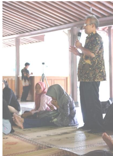
Gambar 10. Guru memberikan tanggapannya tentang wayang pendidikan nasional.