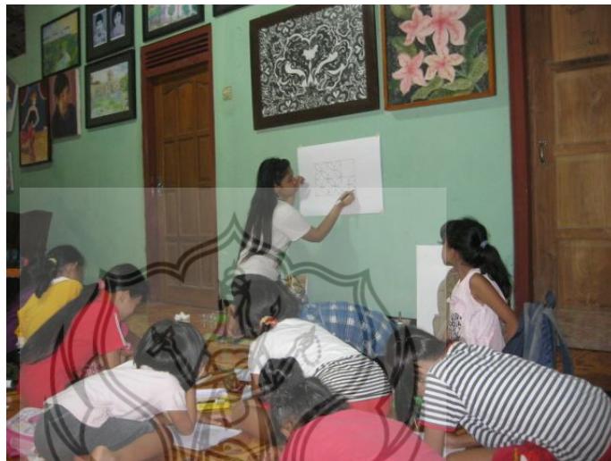
Gambar 1 Mengajar menggambar

menggambar untuk anak-anak SD di rumah dan di masjid serta playgroup di Balai Dusun Mangunan, kegiatan mengajar tersebut penulis lakukan pada paruh waktu. Seringnya berada di lingkungan anak-anak menimbulkan ketertarikan untuk mengamati lebih jauh dunia mereka.