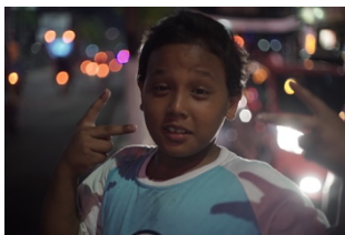
Gambar 1 Still photo film Tole “Children on the street”

Penyutradaraan dalam sebuah film tak lepas dari visi besar sutradaranya. Visi besar ini yang nantinya akan terlihat pada karya filmnya. Pada film “Booking Out” visi besar penyutradaraan adalah menampilkan konstruksi dokumenter. Unsur yang tak lepas dari penyutradaraan film ini adalah proses pengadeganan pemain. Pendekatan yang digunakan dalam pengadeganan pemain yaitu pendekatan impersonator . Pendekatan ini perlu ditunjang melalui referensi adegan, sifat manusia, foto, musik, dan kebiasaan-kebiasaan tokoh. Tokoh Udin, dimainkan oleh seorang aktor bernama Alex Suhendra. Sutradara memberikan beberapa referensi-referensi adegan film dokumenter, salah satunya film “Tole (Children on The Street)”