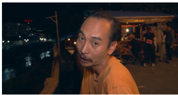
Gambar 2 Contoh subjective shot .

Subjektif shot bertindak sebagai mata penonton. Setiap penonton akan menerima kesan bahwa dia di tempat kejadian dalam film, ia tidak hanya melihat peristiwa dan mengamati, namun ia menyelami dari setiap peristiwa dalam film. Subjektif shot sangat membantu dalam memperkuat sisi dramatik dalam penuturan cerita.