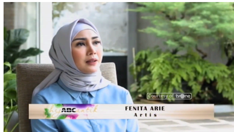
Gambar 1.1 Screenshot Host

Hijab Cantik merupakan program magazine yang membahas tentang fashion hijab bersama perempuan berhijab yang inspiratif. Acara ini dipandu oleh satu orang host yang memandu penonton kesetiap memasuki rubriknya. Diproduksi oleh TV One. Acara ini berdurasi 30 menit. Program ini memberikan inspirasi program ‘ Womenpreneur ’ mengenai cara menyajikan liputan rubrik yang menarik dan informatif.