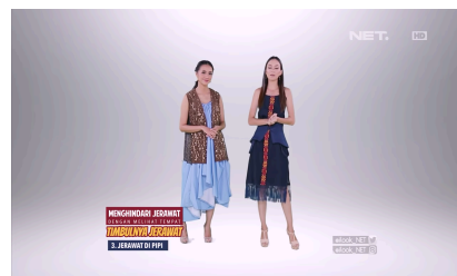
Gambar 1.3 Screenshot Host

Diproduksi oleh NET. Lifestyle dengan durasi program 30 menit, pengemasan program ini begitu ekspresif. Penggunaan warna-warna cerah dan ekspresif, penerapan editing kolase dan split screen , dan banyak sekali penggunaan motion graphic berupa text , bumper , background cinemascop e yang memiliki warna berbagai macam, hingga typografi yang menonjol disetiap segment. Hal-hal tersebutlah yang membuat program iLook ini menjadi referensi dalam pengelolaan editing program magazine show “ Womenpreneur .”