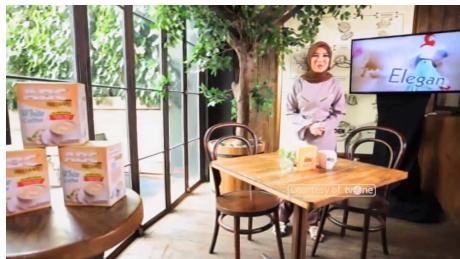
Gambar 1.2 Screenshot Shot size pada saat wawancara dengan narasumber