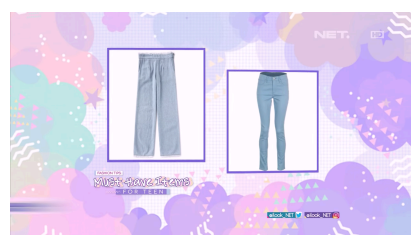
Gambar 1.4 Screenshot penggunaan background cinemascop