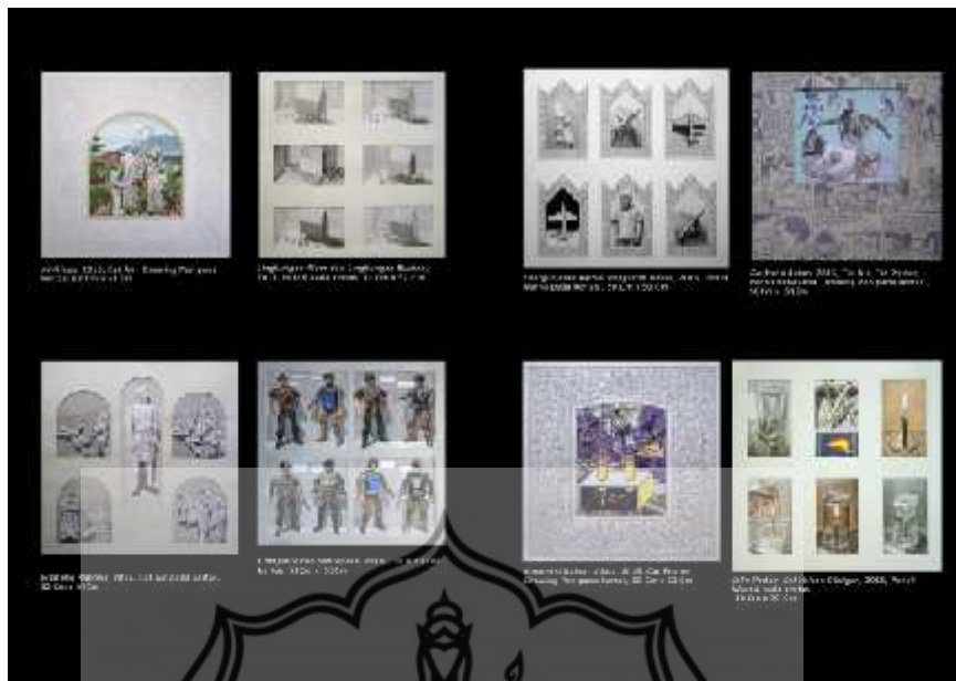
1. Batik Korpri, 2012, 20x30 cm. Korpri (Purabaya), 100% Katun, 2012, 20x30 cm. 2. Korpri Korpri, 2012, 20x30 cm. Korpri (Purabaya), 100% Katun, 2012, 20x30 cm. 3. Batik Korpri, 2012, 20x30 cm. Korpri (Purabaya), 100% Katun, 2012, 20x30 cm. 4. Batik Korpri, 2012, 20x30 cm. Korpri (Purabaya), 100% Katun, 2012, 20x30 cm. 5. Batik Korpri, 2012, 20x30 cm. Korpri (Purabaya), 100% Katun, 2012, 20x30 cm. 6. Batik Korpri, 2012, 20x30 cm. Korpri (Purabaya), 100% Katun, 2012, 20x30 cm. 7. Batik Korpri, 2012, 20x30 cm. Korpri (Purabaya), 100% Katun, 2012, 20x30 cm. 8. Batik Korpri, 2012, 20x30 cm. Korpri (Purabaya), 100% Katun, 2012, 20x30 cm.