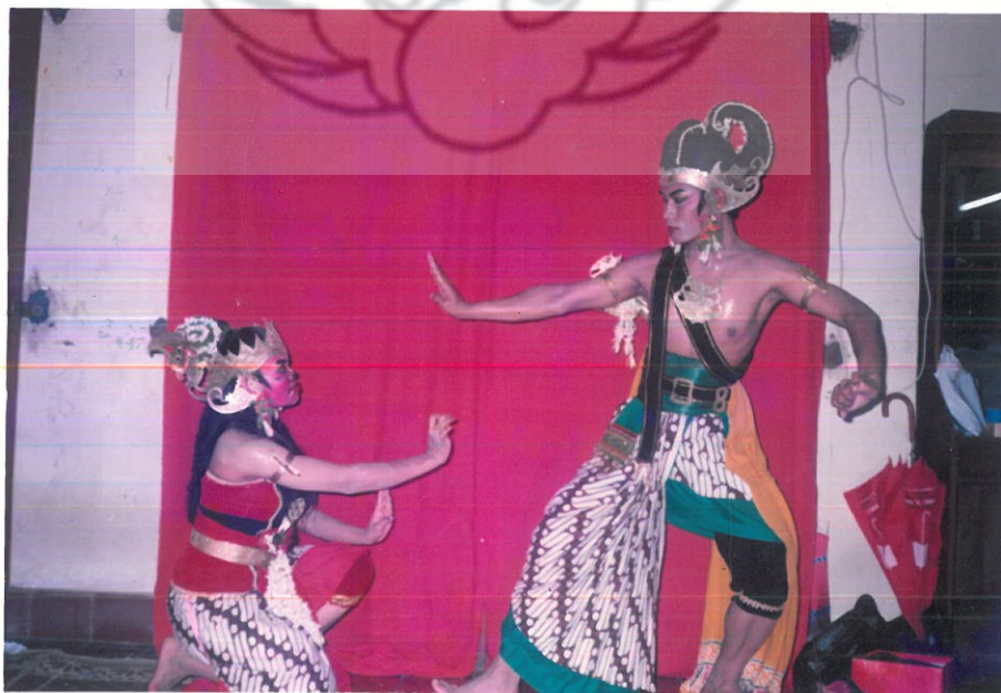
Foto 4. Gerak tari pada engeran Paden Lakmana dan Sarpakenaka.