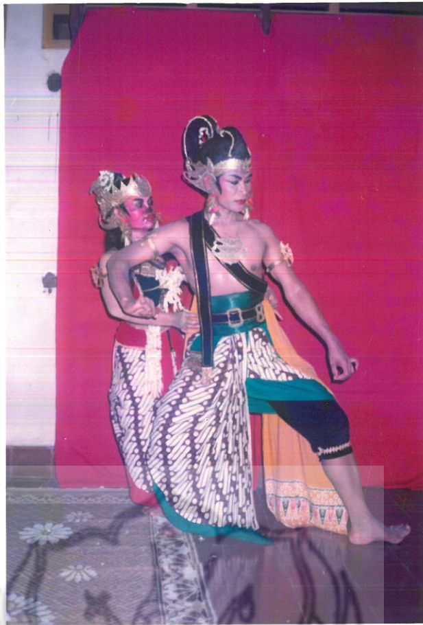
Foto 3. Salah satu adegan Sarpakenaka Pagas.