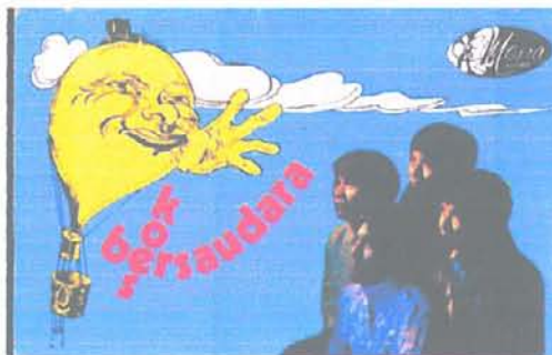
Gambar 3. Album Koes Bersaudara