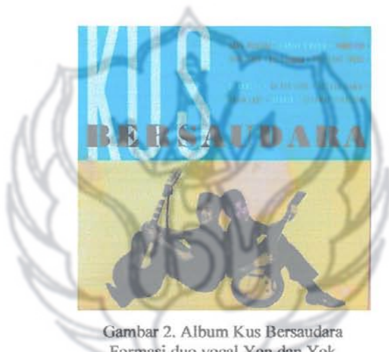
Gambar 2. Album Kus Bersaudara Formasi duo vocal Yon dan Yok