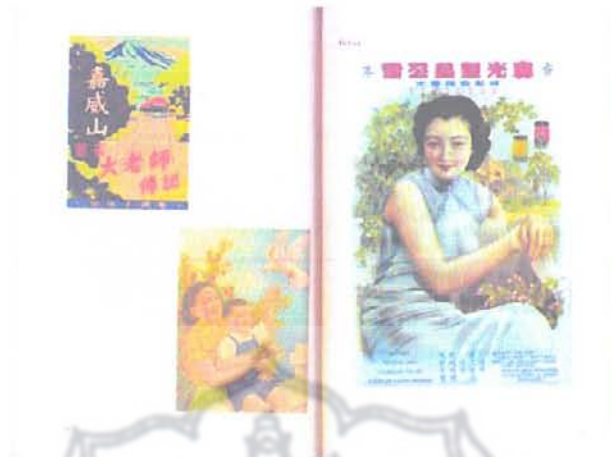
Gambar 5. Ilustrasi grafis Tiong Hoa tahun 1930an

Grafis ini supaya lebih bisa menggambarkan suasana pencitraan pada cerita digunakan berbagai gaya gambar sesuai suasana penggambaran pada cerita seperti ilustrasi drawing, ilustrasi pecil, colouring, digital imaging, dan gaya desain pada layout buku ini.