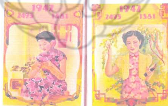
Gambar 6. Ilustrasi grafis Tiong Hoa tahun 1930an Sumber : Ilustrasi grafis Cheng Li Bentara Budaya Tahun 2011.