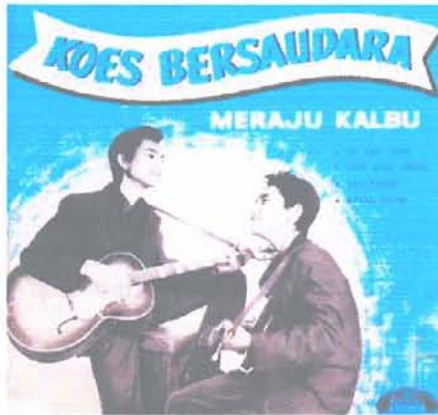
Gambar 1. Album Koes Bersaudara Formasi duo vocal Yon dan Yok