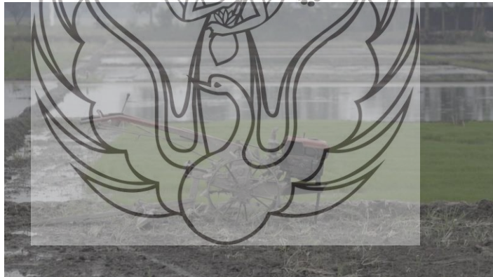
Gambar 34. Foto traktor milik Koko di tengah sawah