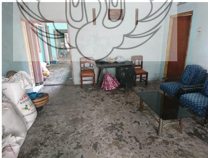
Gambar 30. Foto ruang tamu rumah Sulasmini