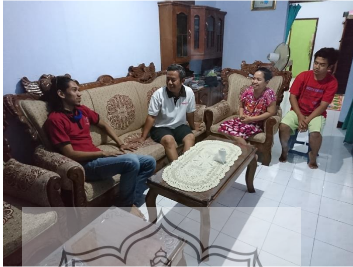
Gambar 33. Foto penulis bersama Koko sekeluarga