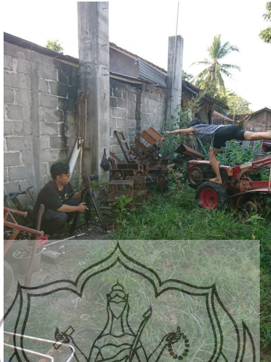
Gambar 37. Foto proses perekaman video scene traktor