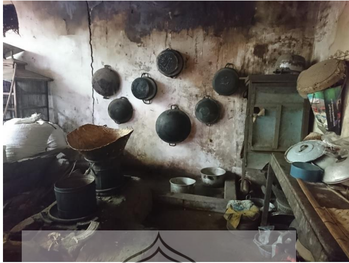
Gambar 31. Foto dapur milik Sulasmini