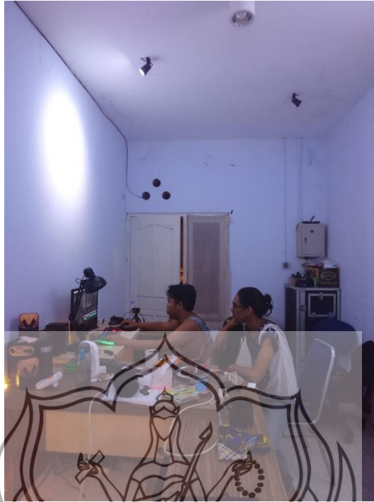
Gambar 39. Foto proses editing di kantor Snooge Art Work