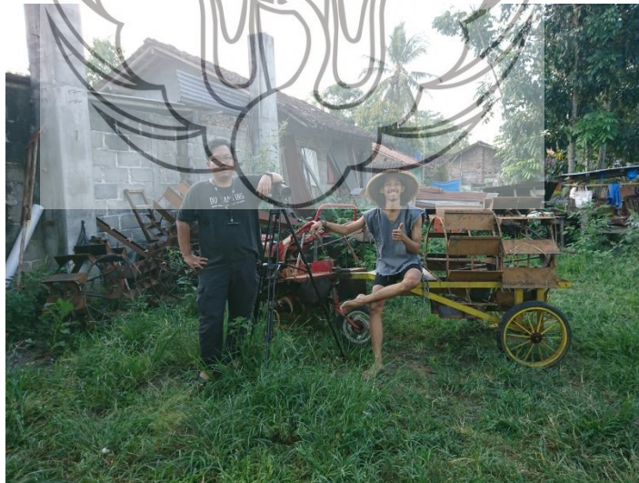
Gambar 40. Foto setelah rekam video scene traktor