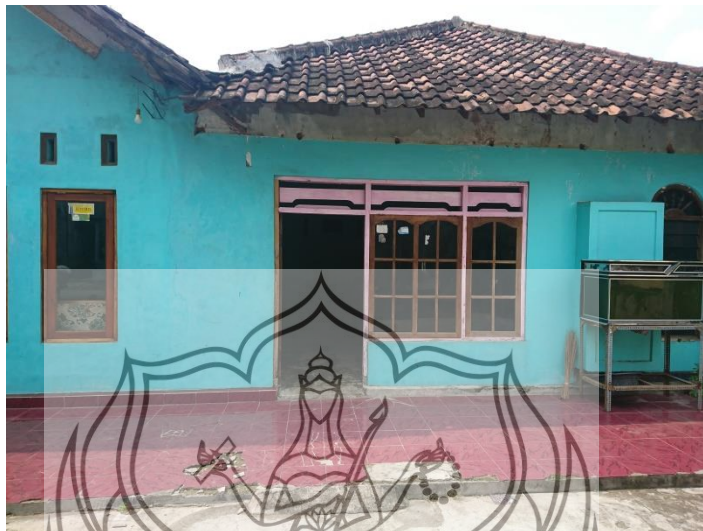
Gambar 29. Foto halaman depan rumah Sulasmini