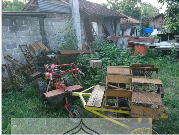
Gambar 35. Foto traktor milik Koko di depan rumah