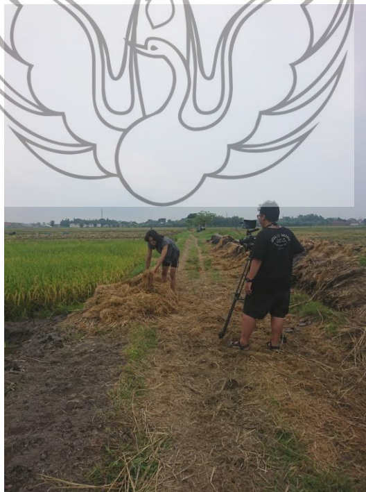
Gambar 36. Foto proses perekaman video scene damen