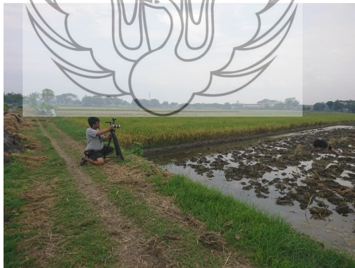
Gambar 38. Foto proses perekaman video scene kaki