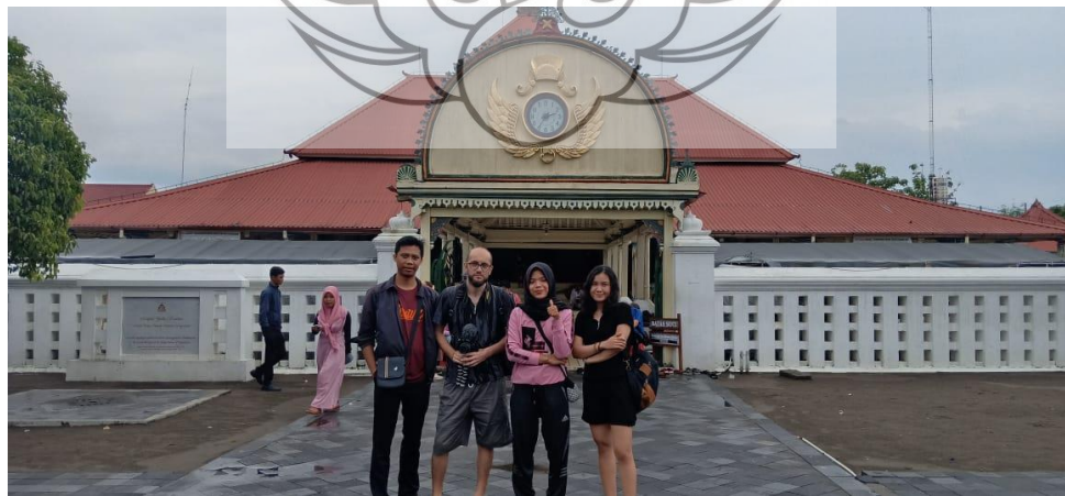
Gambar 40. Rangkuman hasil pengamatan etnografi