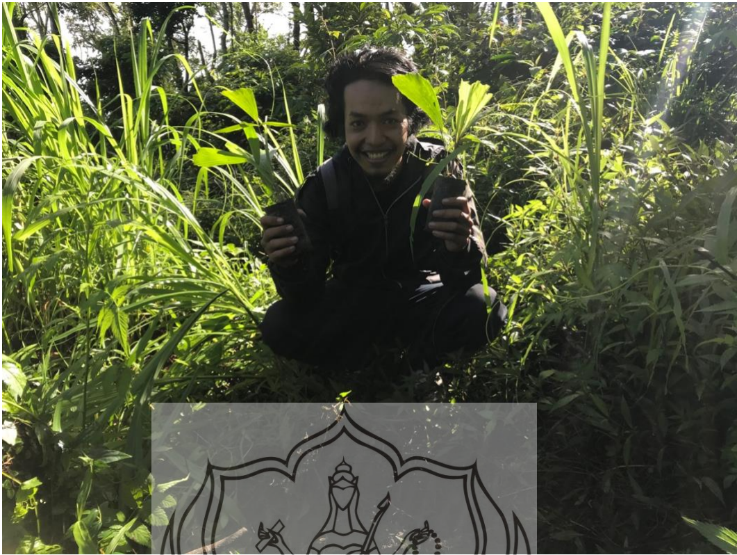
Foto Dokumentasi Penanaman Aren di Hutan Desa Panji