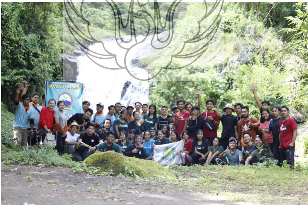
Foto Bersama Setelah Acara Penanaman Pohon Aren