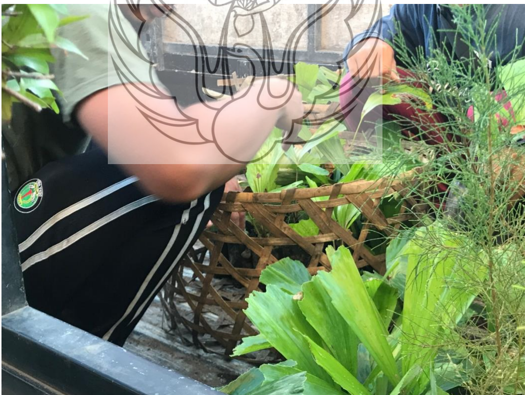
Foto Dokumentasi Penanaman Aren di Hutan Desa Panji