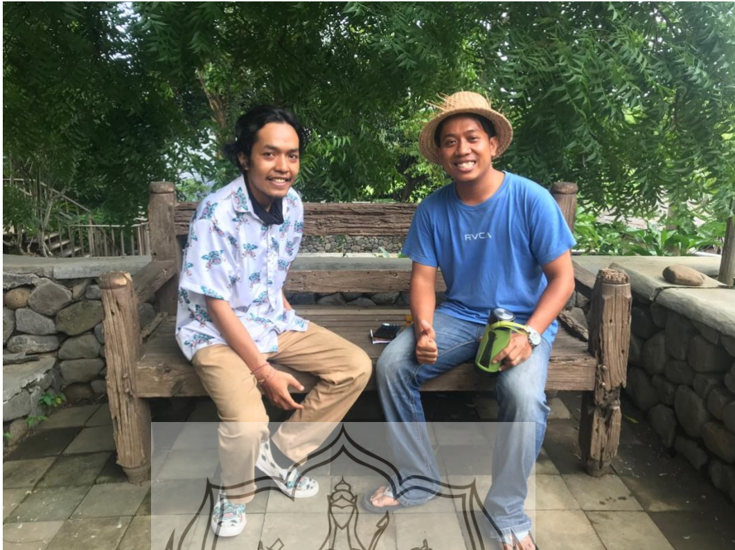
Foto Bersama Ketua Koperasi Pangan Bali Utara