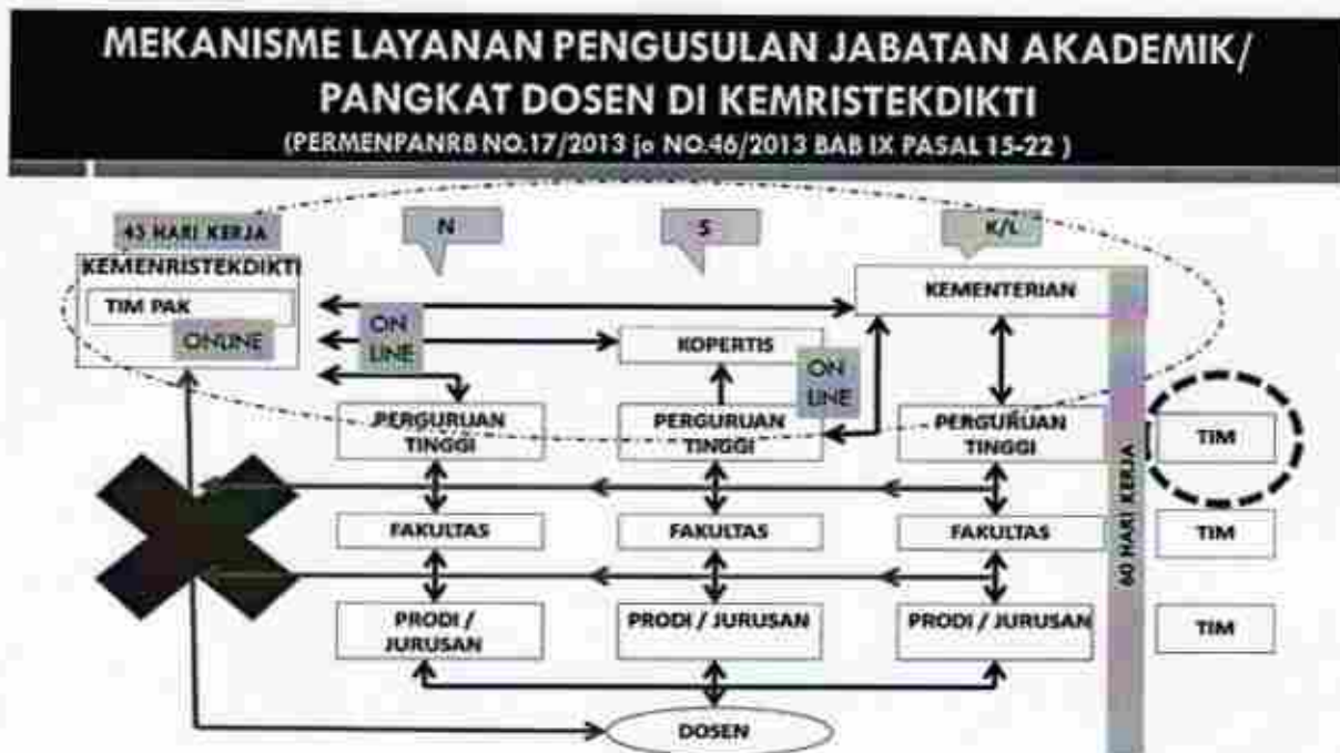
Gambar 1. Mekanisme Layanan Pengusulan Jabatan Akademik/Pangkat Dosen

Kenaikan jabatan akademik/pangkat dosen merupakan bagian tidak terpisahkan dengan pengembangan karir dosen, dengan demikian mekanisme penilaian dan proses kenaikan jabatan akademik/pangkat dosen akan diintegrasikan secara online (daring). Dengan sistem daring diharapkan dapat meningkatkan efisiensi layanan dan mendukung prinsip-prinsip penilaian, sebagaimana pada Gambar 1.