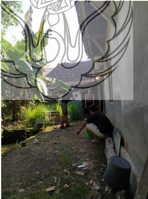
Gambar 39. Proses Pengambilan Gambar