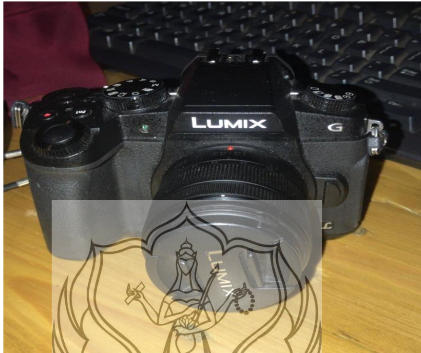
Gambar 46. Salah Satu Kamera dalam Pengambilan Videografi