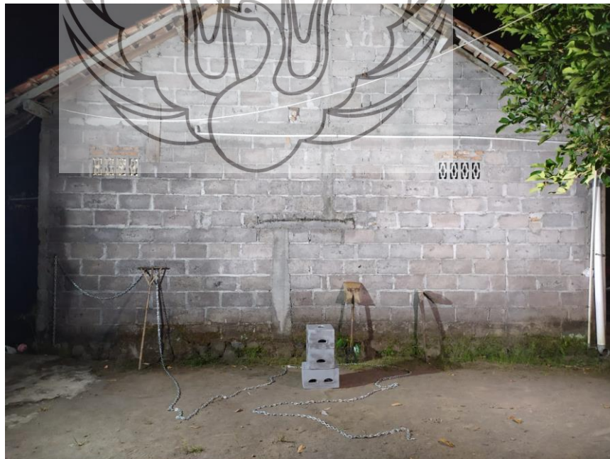
Gambar 43. Setting Tempat Adegan ke Tiga