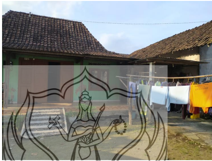
Gambar 34. Lokasi Pengambilan Gambar