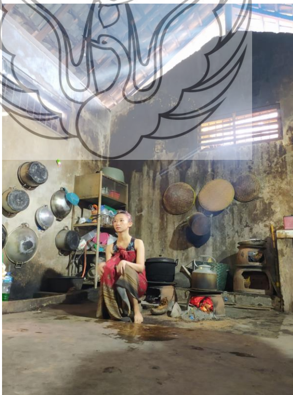
Gambar 37. Shot Dapur