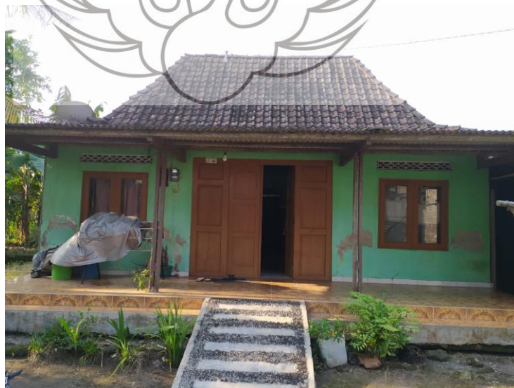
Gambar 35. Lokasi Pengambilan Gambar