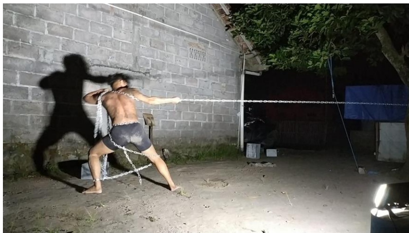
Gambar 44. Proses pengambilan Gambar Shot Malam