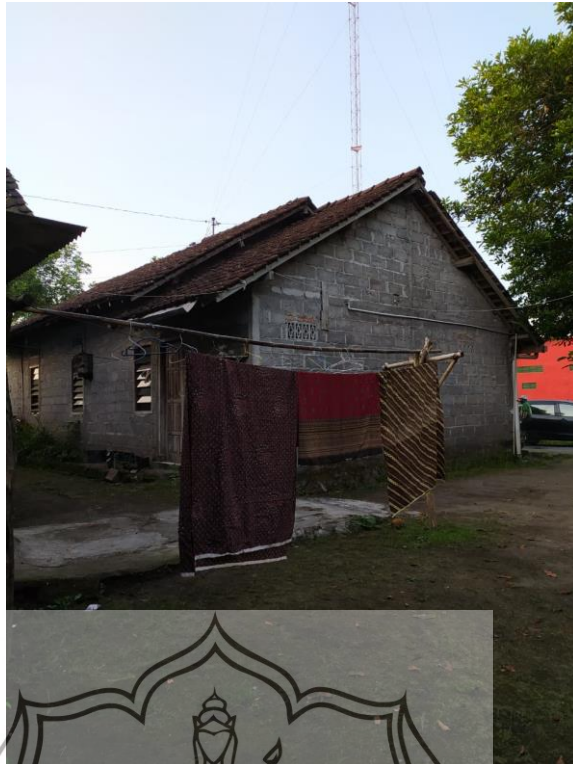
Gambar 36. Lokasi Pengambilan Shot