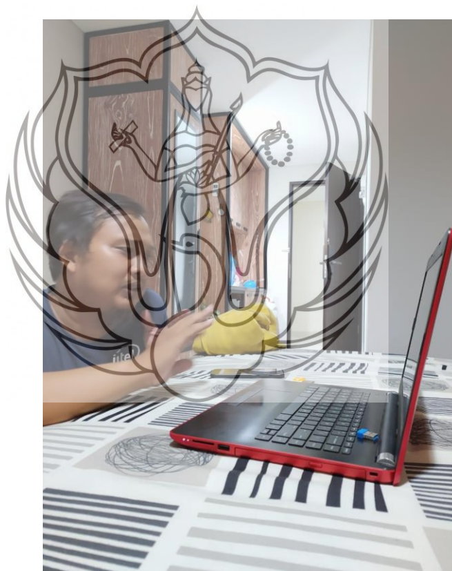
Gambar 45. Proses Editing (Foto: Murtisa, 2020)