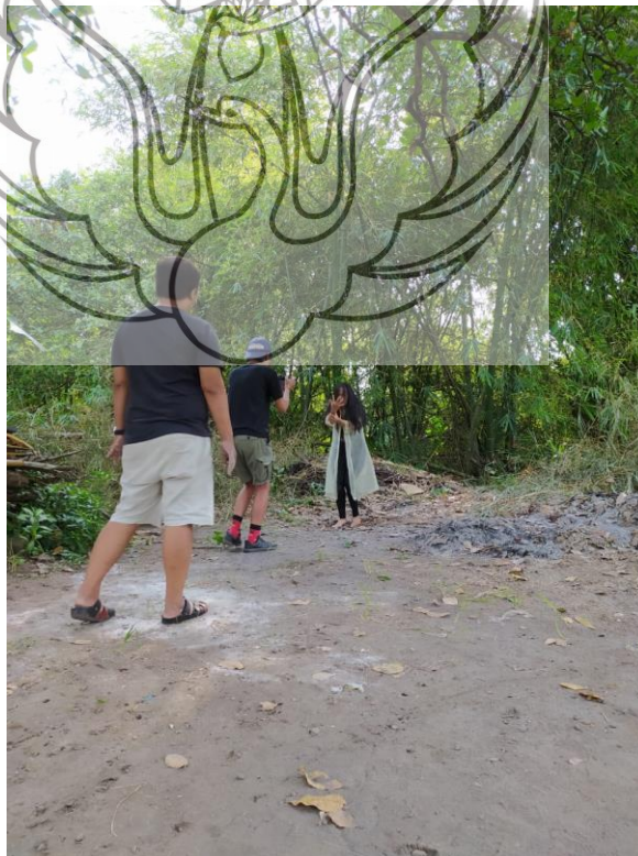
Gambar 41 Proses Pengambilan Scene Bambu