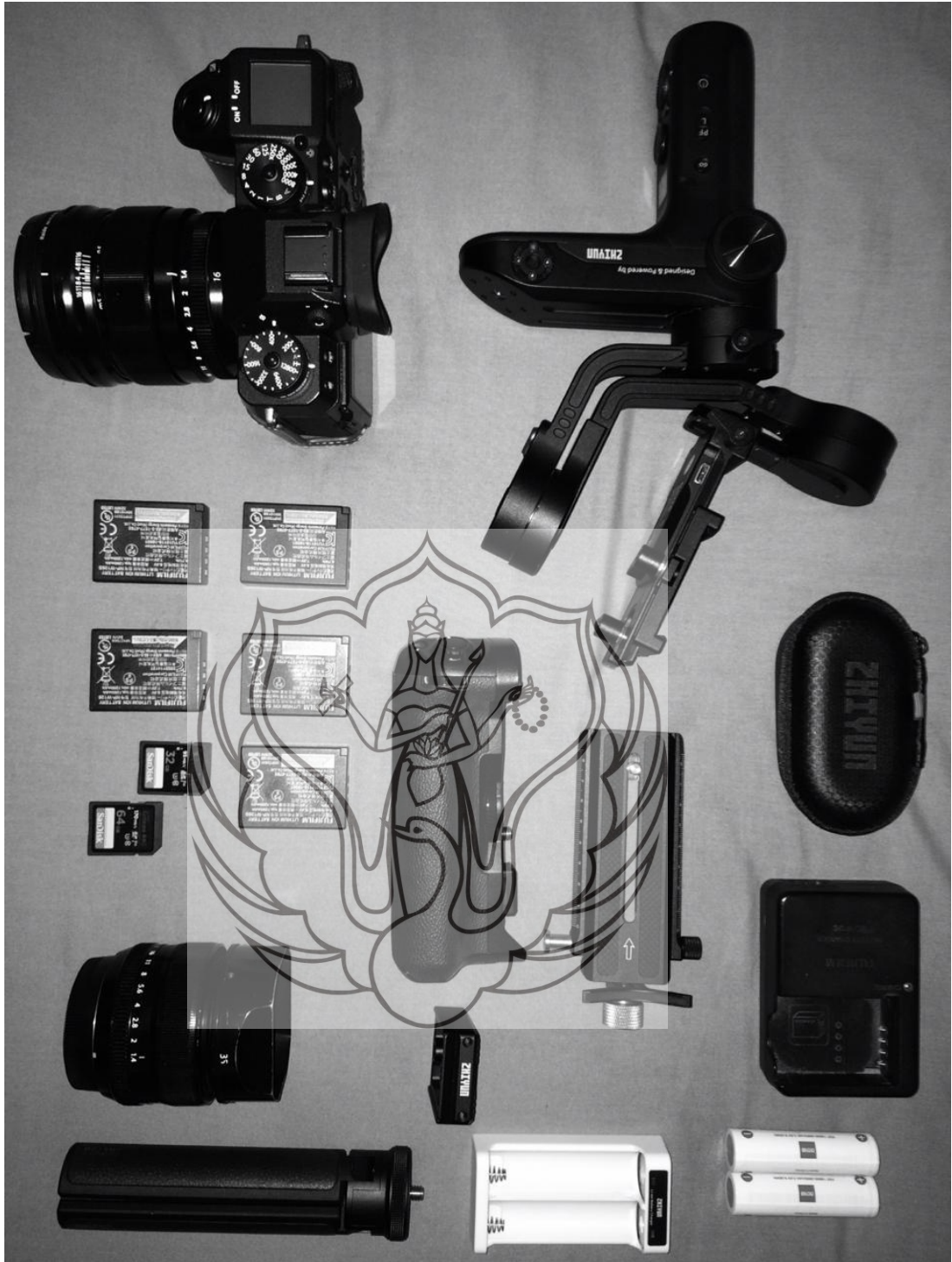
Gambar 47. Peralatan Dalam Pengambilan Videografi