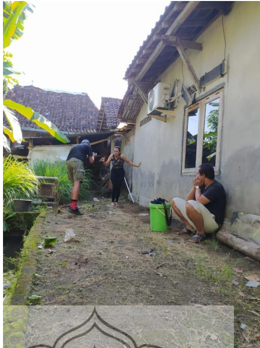
Gambar 38. Proses Pengambilan Gambar di Pelataran Rumah