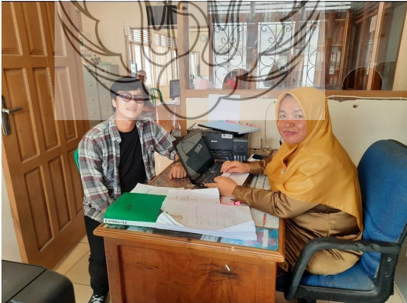
Penulis bersama Chairini