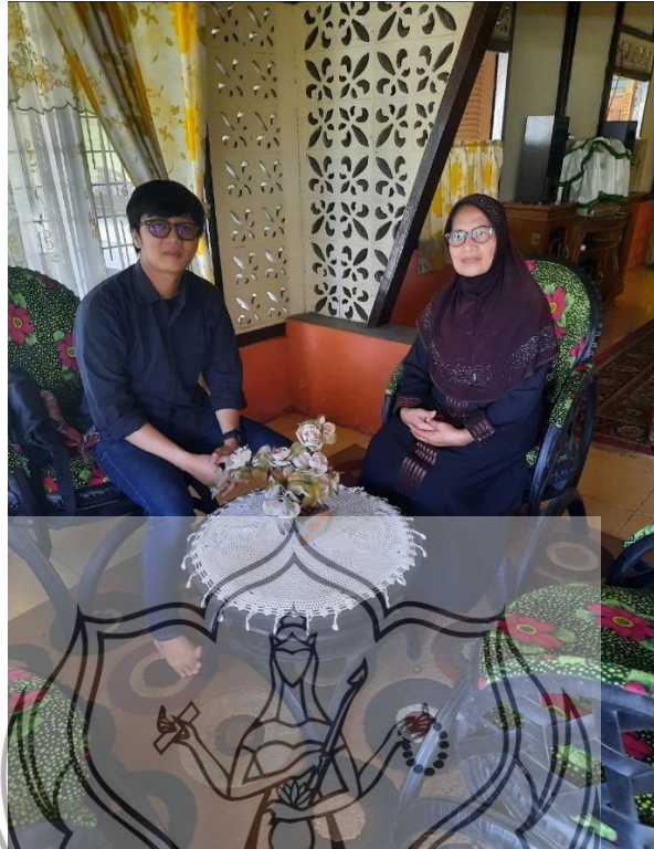
Penulis bersama Deswita Foto: Penulis, 2020.