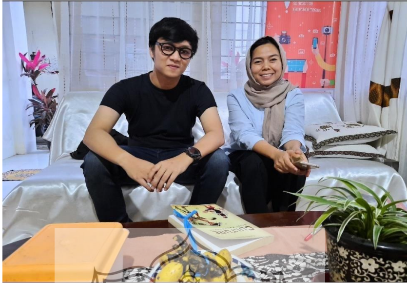
Penulis bersama Rozalia Foto; Penulis, 2020.