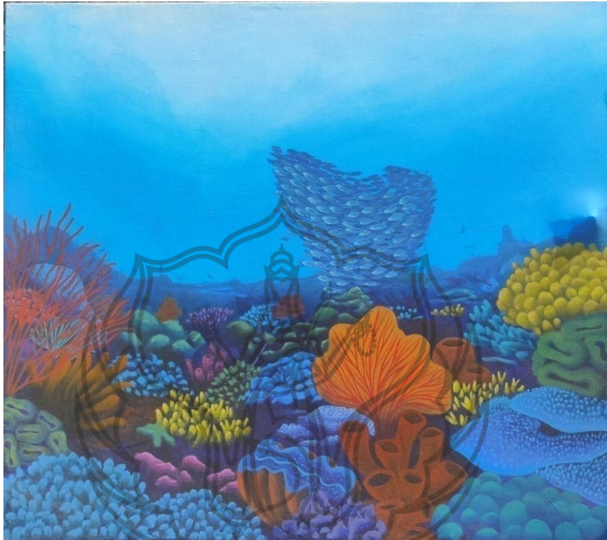
Gambar 1. Ekspektasi Keindahan , 2018 Akrilik pada kanvas, 80 cm x 90 cm

Karya ini adalah lukisan terumbu karang imajiner yang diekspektasikan penulis pada awal mula menyukai terumbu karang yang ada di akuarium. Dengan warna yang mencolok dan terang yang menunjukkan keindahan bawah laut begitu indah secara alami seperti memberi hadiah pertunjukan bagi pengunjung yang melihatnya.