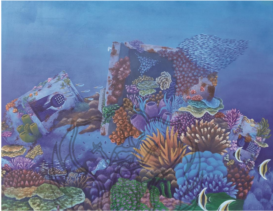
Gambar 2. Harta Terpendam , 2019 Akrilik pada kanvas, 100 cm x 90 cm

Terumbu Karang yang memiliki banyak manfaat bagi peradaban manusia telah dipandang sebelah mata oleh masyarakat di zaman sekarang. Keindahannya mulai kalah dengan kemegahan kapal, khasiatnya tak diperhatikan oleh para ilmuwan kebanyakan, tergantikan dengan obat sintetis. Bagaikan harta yang tersimpan di dalam brankas terpendam hingga rusak dan berceceran menunggu untuk ditemukan. Karang yang mewakili keindahan alam yang tak diperhatikan dan dilupakan oleh masyarakat, terbengkalai dan mulai rusak. Mereka yang beruntung akan tetap bertahan hidup, menunggu untuk disinggahi dan akhirnya dimusnahkan.