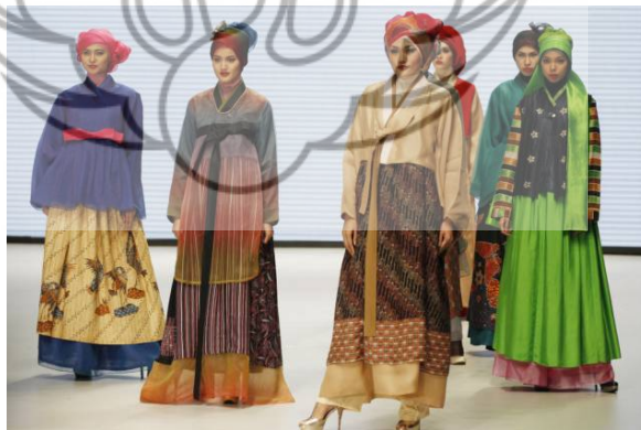
Gambar 1 Busana hanbok modern Dokumentasi Indonesia fashion week 2014 Karya desainer Iva Lativa www. Tabloidbintang.com ( diakses pada tgl 1 oktober 2014, pukul 14.30)

Salah satu busana yang memiliki keistimewaan tersendiri dibandingkan dengan busana-busana lainnya adalah busana pesta. Busana pesta merupakan busana yang dikenakan untuk menghadiri pesta pada waktu pagi, siang, sore, maupun malam hari. Keistimewaan dari busana pesta tersebut adalah selalu dibuat istimewa, baik dari segi desain yang dirancang khusus, bahan dengan kualitas bagus, warna menarik dan mencolok, menggunakan teknik jahit yang halus, serta aksesoris yang indah dan menawan untuk melengkapinya.