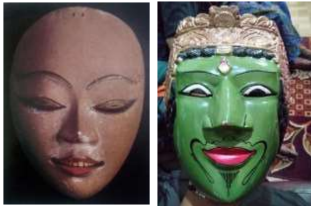
Gambar 1. Gambar sebelah kiri merupakan topeng gaya Jawa Tengah, sedangkan gambar sebelah kanan merupakan topeng Gaya Malang