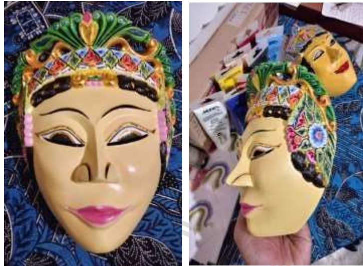
Gambar 2. Topeng Ragil Kuning

Wayang Topeng Gaya Malang digambarkan sebagai topeng tokoh protagonis putri dengan dominan warna kuning.