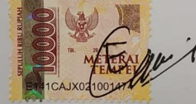
Enggar Bayu Pamungkas