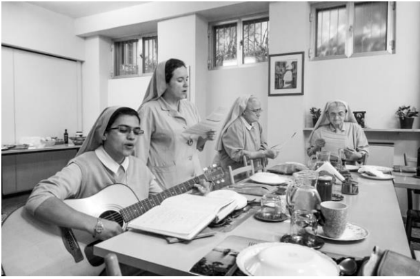
Gambar.3 Judul: Ravasco nuns singing together