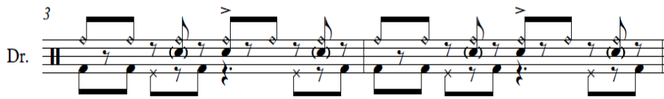
Notasi 2. Pola ritme pada bagian Chorus dan Coda

Pada bagian ini Jhon Bonham memainkan bell pada ride cymbal di down beat dan up beat atau memainkan bell ride cymbal dengan nilai quarter note pada triplet setiap ketukan sebagai aksent pada pola ritme tersebut. Pada kick bass drum dan snare pola ritme yang dimainkan masih sama dengan bagian intro dan verse . Kemudian kaki kiri John Bonham memainkan teknik open close hi-hat pada down beat setiap ketukan kedua dan keempat (Lim & Cho, 2018).