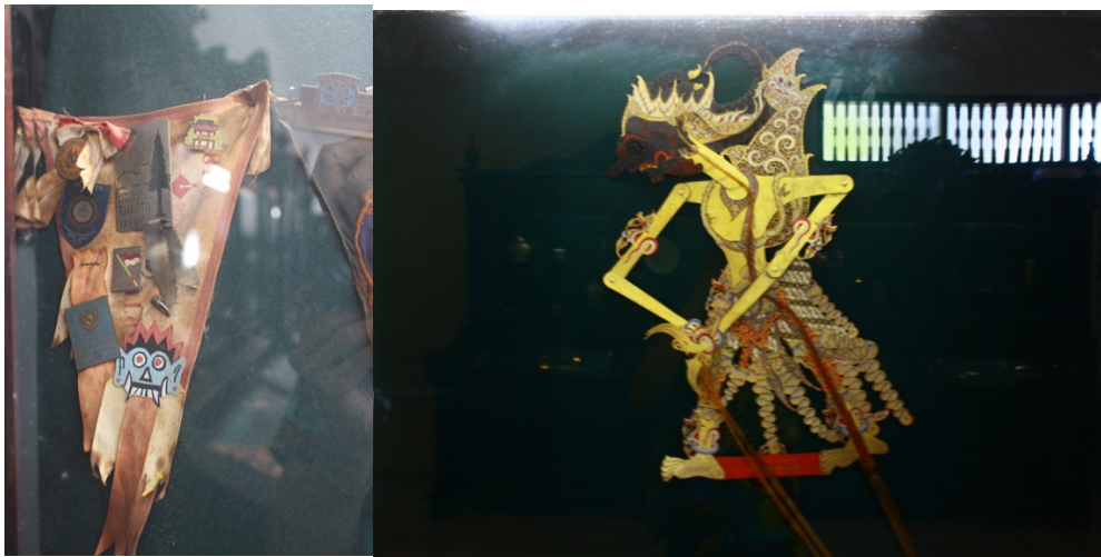
Berkunjung ke Keraton Ngayogyakarta