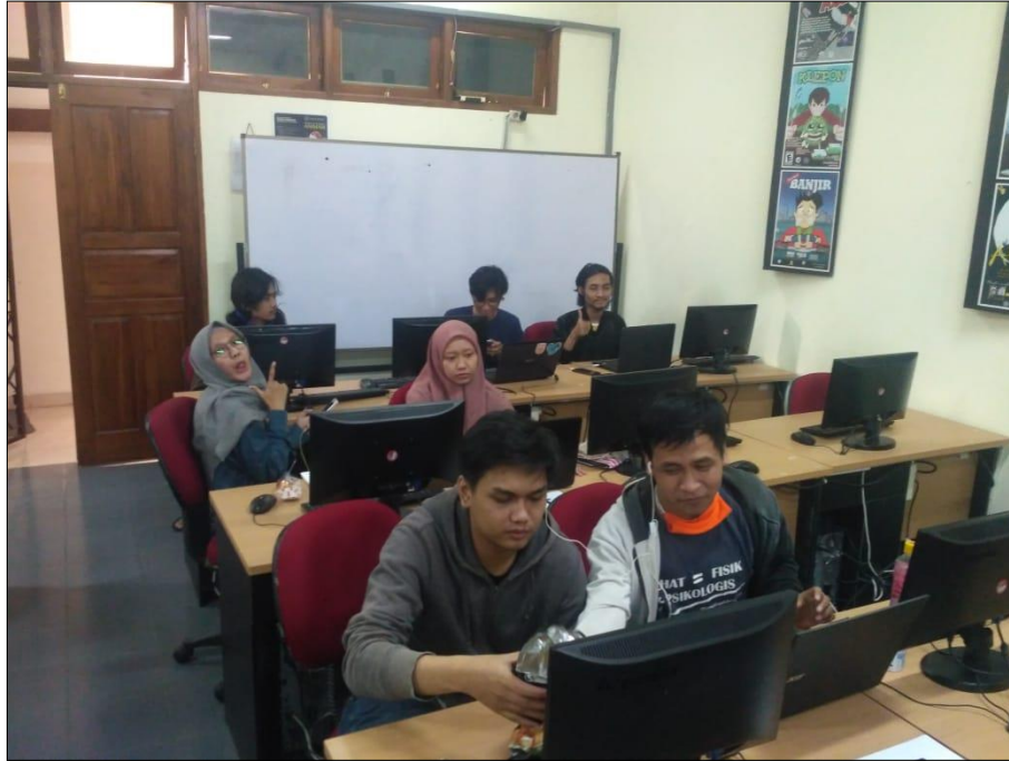
Gambar 8: Suasana persiapan screening pameran via livestream Youtube