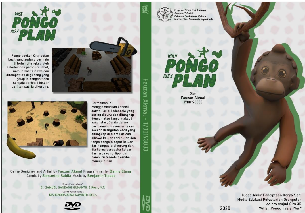
Gambar 6: Cover Case DVD When Pongo has a plan