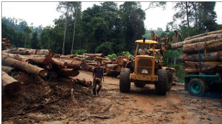
Gambar 4: Traktor dan Truk yang mengangkut kayu dari hutan