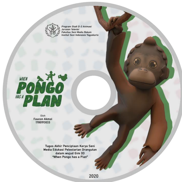
Gambar 7: Cover DVD When Pongo has a plan