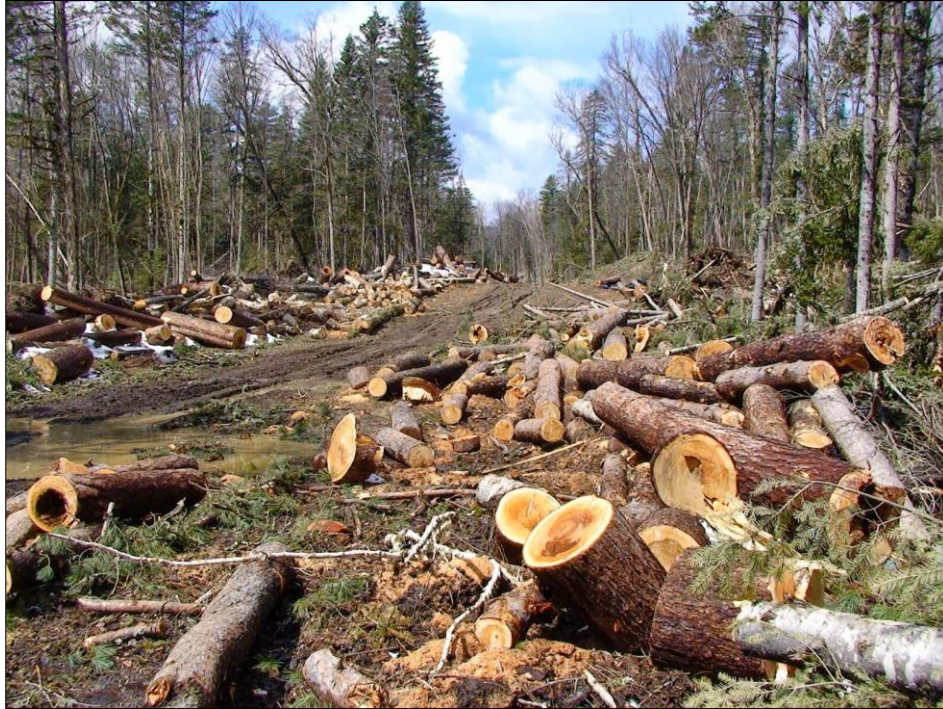
Gambar 3: Kondisi hutan yang gundul