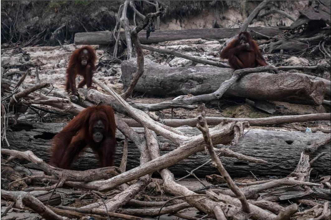
Gambar 1: Orangutan dan rumahnya yang hancur