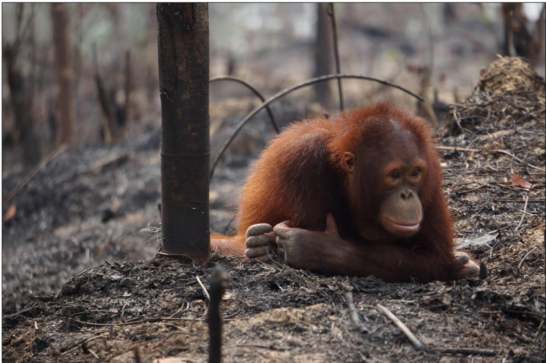
Gambar 2: Orangutan dengan hutan yang habis terbakar